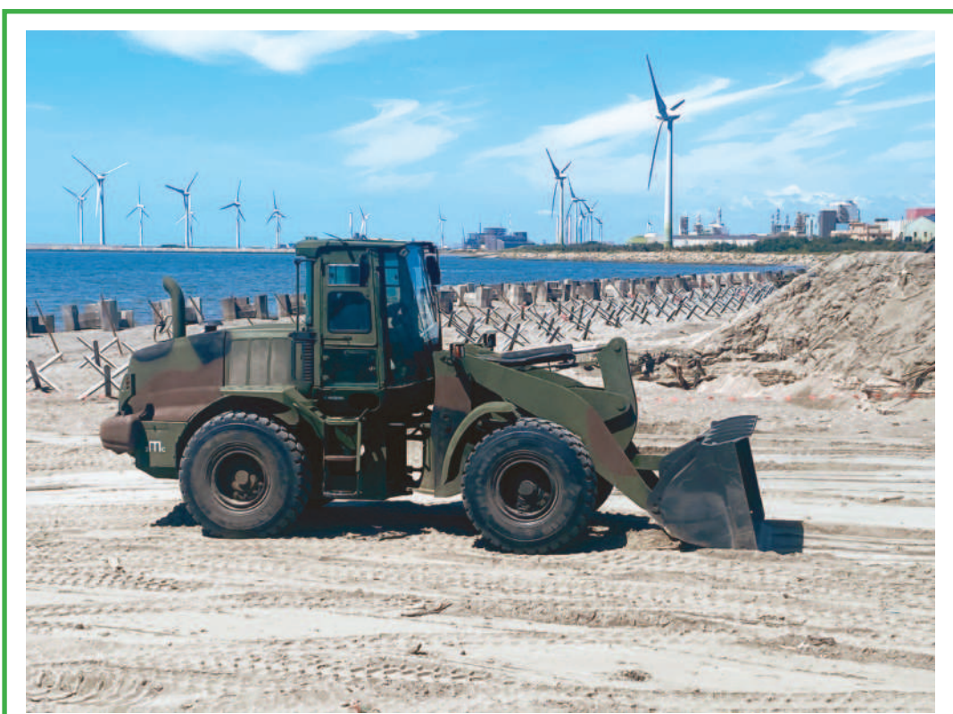
↑國軍「漢光39號演習」實兵演練二十四日展開，國軍第五作戰區在彰化伸港海灘實施「阻絕設置暨陣地編成」，陸軍工兵部隊駕駛推土機，在海灘上設置阻絕設施。

陸軍第六軍團發言人史順文少將表示，下午三點多，基隆陸軍六軍團三支隊在處理外島回運的一二〇迫砲，處理過程中一枚一二〇迫砲不明原因爆炸，造成九人受傷，其中兩名重傷。這批彈藥是由外島回運的一二〇迫砲，排定處置時間就是在二十四日下午，與漢光演習沒有直接相關。 事發後，基隆地檢署指揮主任檢察官陳照世及檢察官李怡蓀展開調查，下午六時許前往祥豐營區，蒐集相關事證，釐清事件發生原因及過程。 國防部長邱國正晚間赴醫院探視，並表示對官兵執勤負傷深感遺憾與不捨，指示相關單位給予最妥適協助，強調會調查釐清。 陸軍司令部晚間發布新聞稿說明，基隆彈藥分庫今日編組彈檢人員，執行馬祖回運彈藥檢分例作業時彈體炸裂，造成檢分作業區附近人員受傷。 陸軍強調，已成立專案小組詳查事發經過。 此案共有九位士兵受傷，其中一人重傷在基隆長庚手術中，轉院內湖三總一重傷、五輕傷，兩名輕傷患者出院。