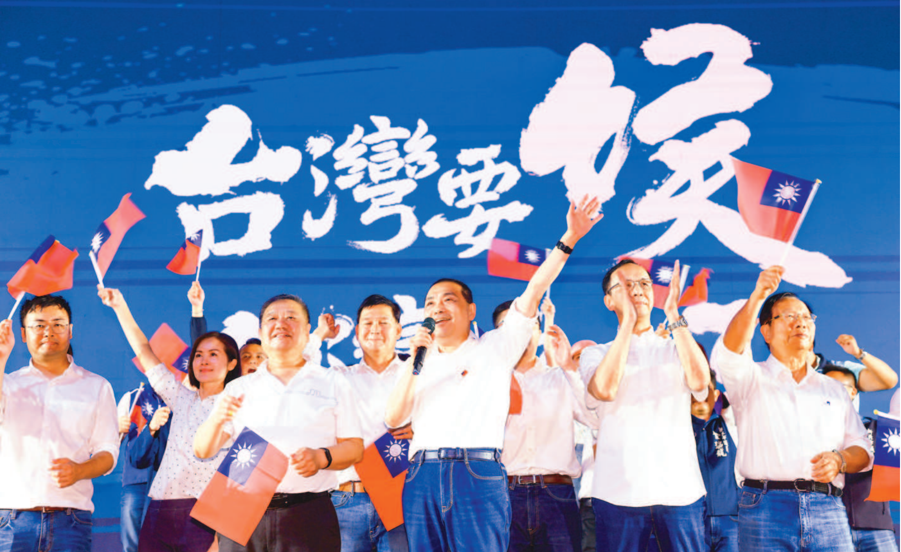
←國民黨二十日晚間在 新北市新莊區舉行「台灣 要侯！台灣要好！」造勢 大會，國民黨主席朱立倫 （前右二）與黨籍總統參 選人侯友宜（前中）同台 出席，場面熱絡。 （中央社）