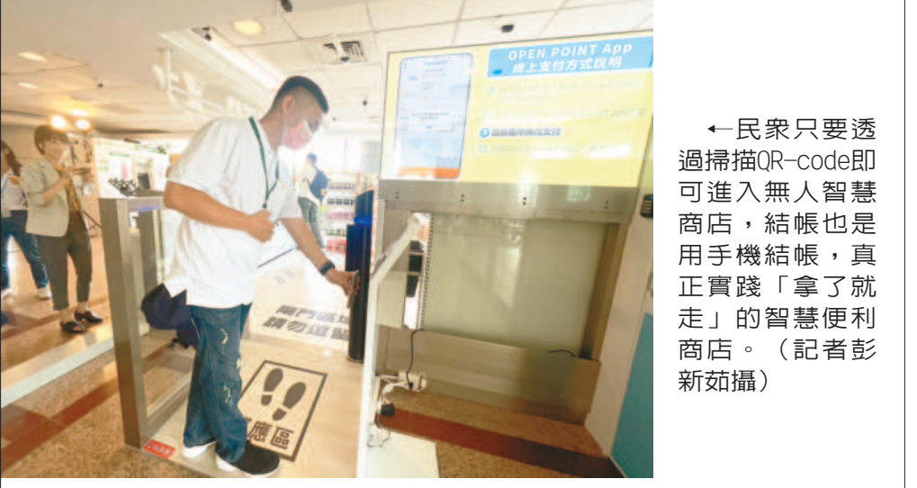
←民眾只要透過掃描QR-code即可進入無人智慧商店，結帳也是用手機結帳，真正實踐「拿了就走」的智慧便利商店。