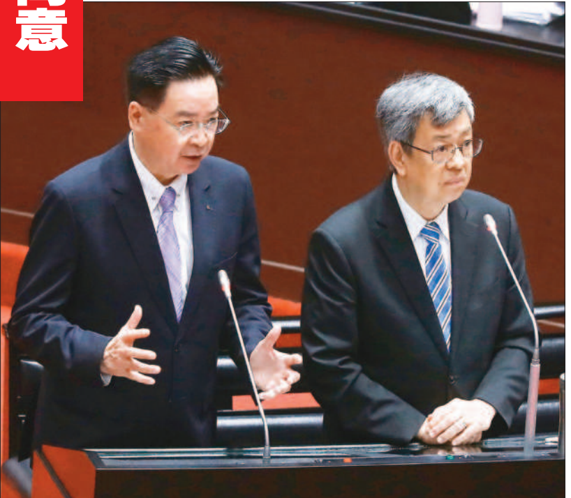
↑美國聯邦參議院18日一致同意通過「美台21世紀貿易倡議首批協定實施法案」。行政院長陳建仁（右）19日赴立法院專案報告並備詢，表示期待協定儘速生效。（中央社）

【本報記者王超群／台北報導】美國聯邦參議院在華盛頓時間十八日晚間一致同意通過「美台二十一世紀貿易倡議首批協定實施法案」，將在遞交美國總統拜登簽署後生效。行政院長陳建仁十九日在立法院表示，台美對於促進雙方貿易都有共識，希望互進互利；對於前美國總統川普嗆台搶走美國晶片生意，外界質疑綠營嗆聲，他表示，川普應該要對事實有更多的了解，雖然高階晶片多數都是台灣製造，但是IC設計都是在美國。 國民黨立委江啟臣昨日在質詢時，詢問陳建仁是否接受川普嗆台搶走美國晶片的講法。陳建仁表示，他當然不願受川普講的，台美關係是雙贏互利的貿易關係。川普提出的數字根據都是錯的，川普指全世界九成晶片都是台灣製造，但其實只有高階晶片。陳建仁指出，川普應該要對事實有更多的了解，雖然高階晶片多數都是台灣製造，但是IC設計都是在美國。 美國聯邦參議院在華盛頓時間十八日晚間一致同意通過「美台二十一世紀貿易倡議首批協定實施法案」。陳建仁指出，這次台美貿易倡議，實際上就是為了雙方國家利益、雙方的企業利益談判，且談判過程中台灣很開誠布公、誠懇的談了相關重要議題，雙方都是站在雙贏互利的角度。經濟部部長王美花在列席前接受媒體聯訪表示，台灣的半導體客戶主要來自美國，相關的設備也跟美國有密切關係，且美國多次提到台灣是重要夥伴，所以台美是重要的夥伴關係，而不是對立關係。 美國在台協會處長孫曉雅表示，美台經貿關係歷史悠久，台美二十一世紀貿易倡議起點，雙方得以增進貿易和投資關係。她表示，幾週前，台美雙方達成歷史性協定，接下來將繼續就剩餘章節協商。該倡議簽署首批協定，對美國拜登政府來說是標誌性的一大成就，等於為全世界設下模範，展示美國未來將如何擴大、推動雙邊貿易的標準；台美二十一世紀貿易倡議將進入第二輪談判，她相信會在討論中看到具體成果。