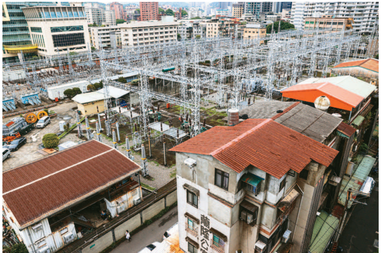
↑台灣綜合研究院廿四日公布三月整體產業電力景氣燈號，全國產業高壓以上用電量較去年同期減少四點七九%，連續六個月呈現衰退藍燈。圖為北市文山區萬隆變電所。