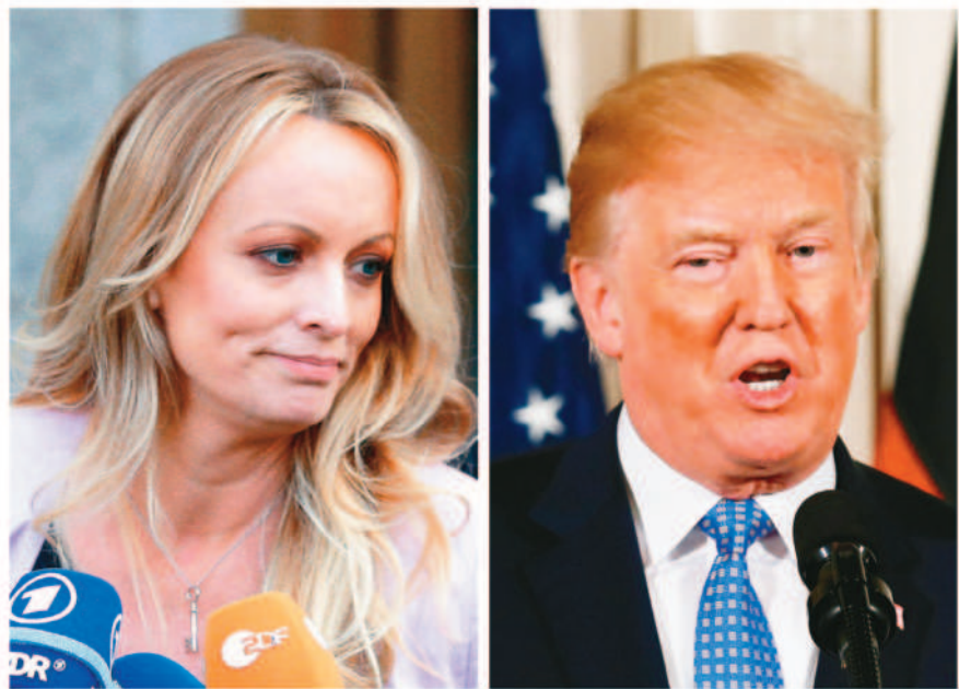
→川普（右）因涉嫌支付成人片女星「暴風女丹尼爾斯」（左）封口費，遭紐約大陪審團投票決定起訴，成為美國史上首位被控刑事罪的前總統。

本報綜合外電報導 美國前總統川普因涉嫌支付「成人片女星」丹尼爾斯封口費，遭紐約大陪審團投票決定起訴，成為首位被控刑事罪的前總統，改寫美國歷史。但根據美國憲法，川普就算被起訴甚至定罪，都不會妨礙他二〇二四年參選總統。 法新社報導，成人片女星丹尼爾斯和川普的孽緣始於多年前。二〇一八年，她爆料曾在二〇〇六年夏天和川普發生過性關係。川普支持者不斷在社群媒體對她辱罵，拿川普替她取的綽號「馬臉」恣意嘲笑，她卻泰然自若，甚至曾考慮進軍政壇。 川普否認兩人有性行為，並以「敲詐」和「徹頭徹尾的騙局」來指控丹尼爾斯。可以確定的是，丹尼爾斯在二〇一六年總統大選之前，獲得一筆十三萬美元的封口費。而這筆錢正是曼哈頓地區檢察官起訴川普的核心因素，稱他可能違反選舉經費法。川普被證實遭起訴後，丹尼爾斯在推特發文表示：「我收到太多私訊，根本回覆不來；我也不想灑了我的香檳。」並不忘標註「#stormy」來替自己的周邊商品打廣告。 在丹尼爾斯啞飲香檳的同時，她的律師團則發表了較為清醒的立場聲明：「川普遭到起訴並不令人高興。大陪審團的認真與盡職必須受到尊敬。現在就讓真相和正義獲得勝利吧。」 川普成為美國史上首位被控刑事罪的前總統後，美國有線新聞網（CNN）解答讀者最關心的數個問題，其中之一便是，根據美國憲法，川普就算被起訴甚至定罪，都不會妨礙他二〇二四年參選總統。 法新社報導，川普痛批紐約大陪審團因他涉嫌支付成人片女星封口費而起訴他的決定，並怒斥檢察官和政治對手。他在聲明中強調：「這是史上最高層級的政治迫害、選舉干預。」