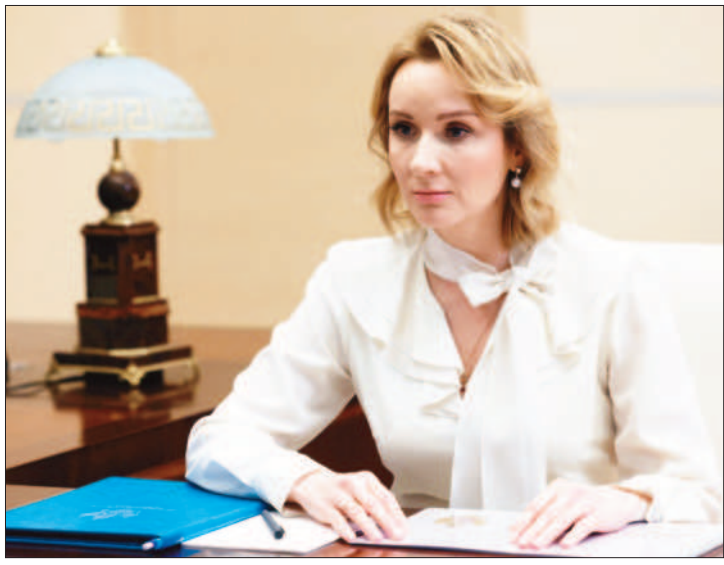
←↑國際刑事法院當地時間十七日對俄羅斯總統蒲亭(左圖)及俄國負責兒童權益的官員利沃瓦·貝洛瓦(右圖)發布逮捕令，他們兩人被指控犯下戰爭罪嫌。