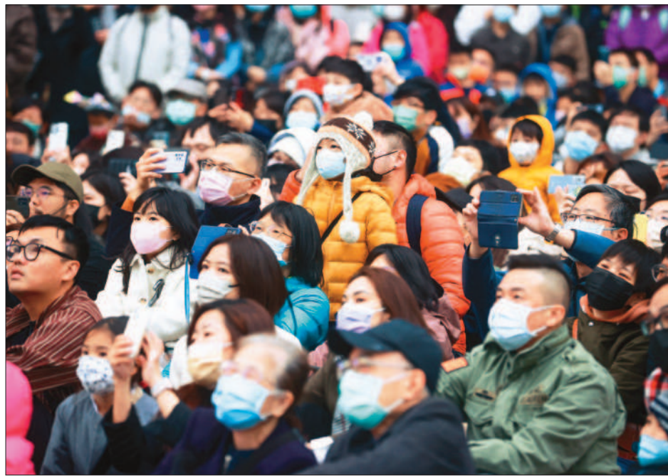
→疫情趨緩，口罩令第2階段自20日起鬆綁，醫療照護機構、公共運輸及特殊運具等指定場所，仍強制戴口罩。（中央社）

最年輕死亡個案為40多歲男性，有心臟病及糖尿病史，曾接種3劑疫苗，10月25日因發燒、咳嗽、呼吸困難至急診，檢查有肺炎住院，10月31日新冠PCR陽性確診且有呼吸窘迫，因此轉入加護病房接受氧氣及瑞德西韋等治療，後續因多重併發症持續住院，1月30日病況惡化不幸過世，死因為新冠肺炎。