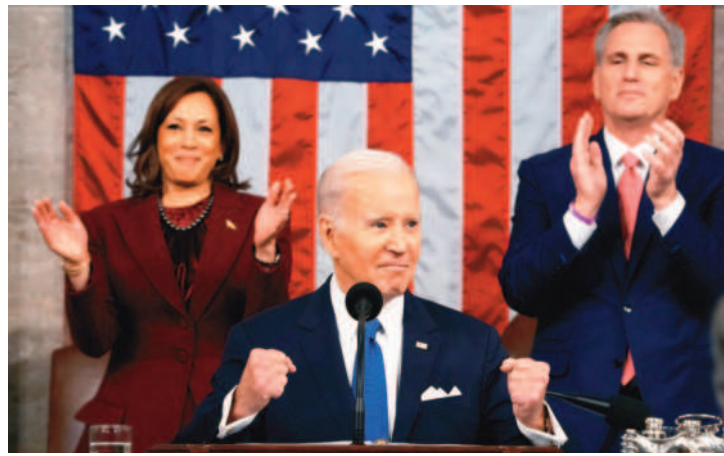
↑美國眾院議長麥卡錫(右)是否訪台，是今年台海難以逆料的暗潮之一。

兩岸交流、對話，設法解決農漁等問題，執政黨做不到的事，現在由在野黨做到了。當沒有政治權力的人，都願意為解決問題而努力時，有政治權力的人如果還動輒威脅、質疑，那是非常不負責任的。 民進黨將訪問團貼上「親中賣台」、「朝共」的標籤，是膝蓋式反應；舉凡與大陸接觸交流，不必問其成果，反正都是被統戰。以「匪諜」、「賣台」之名指控兩岸接觸交流的事件，未來會隨著選舉活動接近愈來愈多。把髒水潑向在野黨，目的就是想把透過認知作戰，將挺綠、反中的選票極大化。