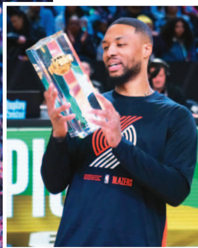
↓拓荒者球星里拉德3度參加三分球大賽，終於奪冠。