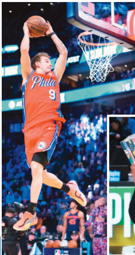
←76人小將麥克隆奪下NBA灌籃大賽冠軍。