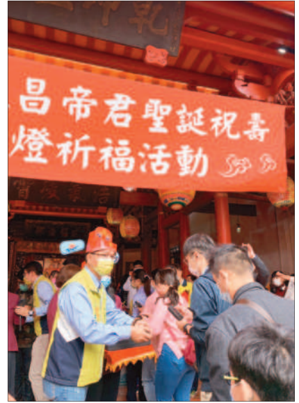
↑文昌帝君祝壽祈福大典後，由林世賢為發給參加考生一組智慧筆，祝考運亨通。

彰化市公所十九日在縣定古蹟關帝廟舉辦隆重的文昌帝君祝壽慶典，另鑑於春季將到，為此佈告各地莘莘學子，一併舉行點智慧燈為考生祈福活動，同時貼心準備「文昌靈印」，讓考生加蓋在准考證影本、課本、書包等用品上，以及「開運筆組」等，以為考生加持，林世賢市長期許所有的考生都能考試順利、高中金榜！ 主祀關聖帝君的彰化市關帝廟，配祀的文昌帝君一直是考生或想升官民眾考前膜拜的好地方。民國一〇六年一場火警造成文昌殿全毀，同年八月重建完成入火安座，繼續庇佑考生。每到春季，廟方特別準備了香、花、果及芹菜、蔥、蒜、水、包子和粽子等供品為考生祈願，考生也會影印准考證投入文昌殿的櫥櫃內，祈求文昌君的庇佑考出好成績。