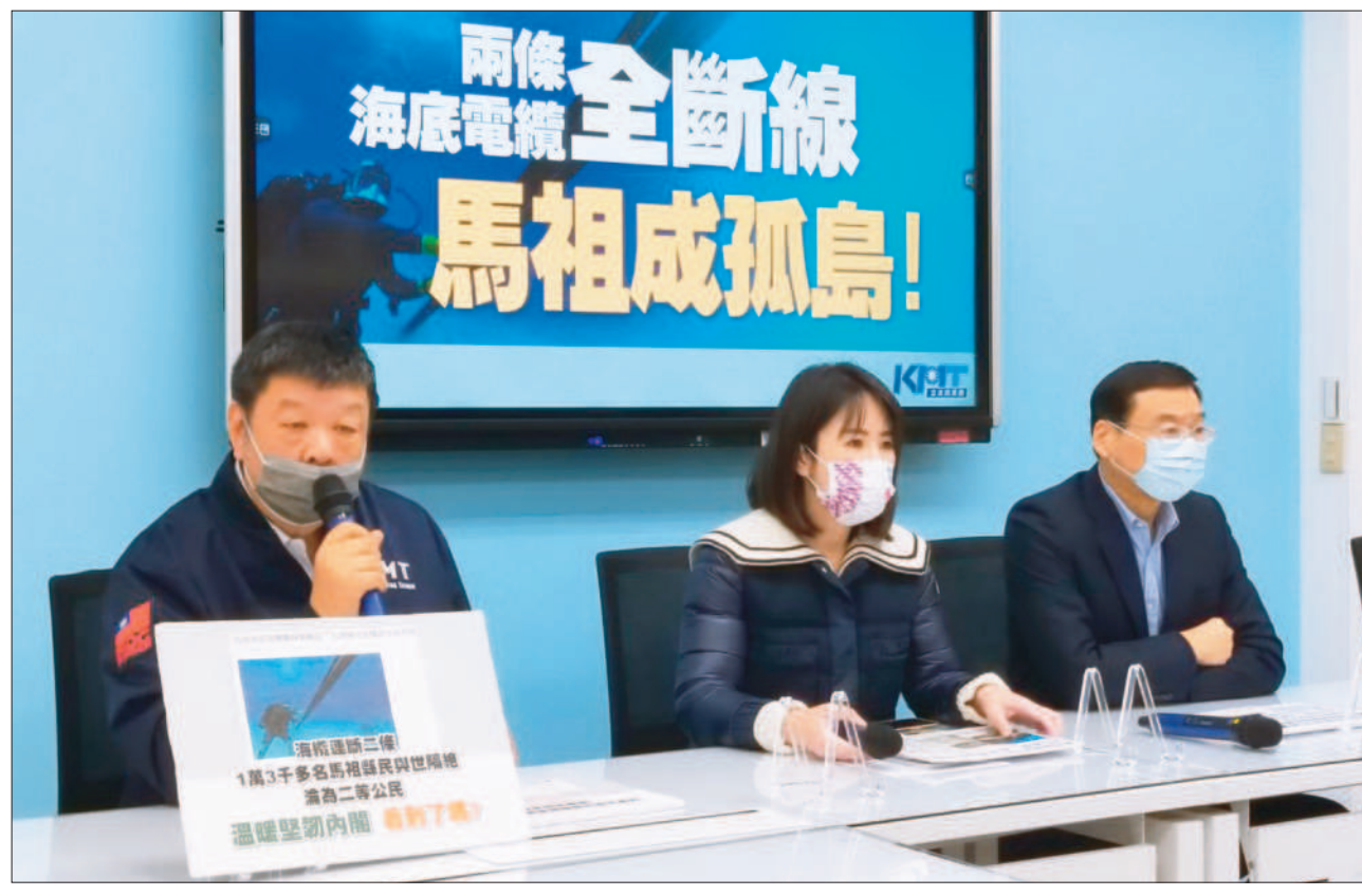
→兩條海底電纜全斷線，國民黨團批政府讓馬祖成孤島。