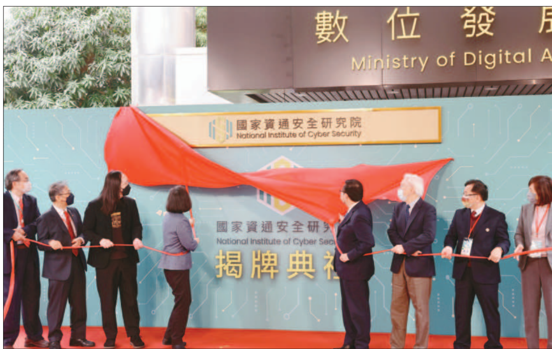
↑總統蔡英文（左4）10日上午在行政院資安長、副院長鄭文燦（右4）與數位發展部長唐鳳（左3）等人陪同下，出席國家資通安全研究院揭牌典禮。（中央社）

土耳其強震已釀超過2萬人死亡，台灣救援隊與土耳其救援隊合作執行任務時，發現一名女性生還者，她被壓在水泥柱下，露出一隻腳，還能與救難人員對話。搜救人員經過19多小時奮戰，已順利救出女子。（圖／消防署提供，文／中央社）（相關新聞刊A2）