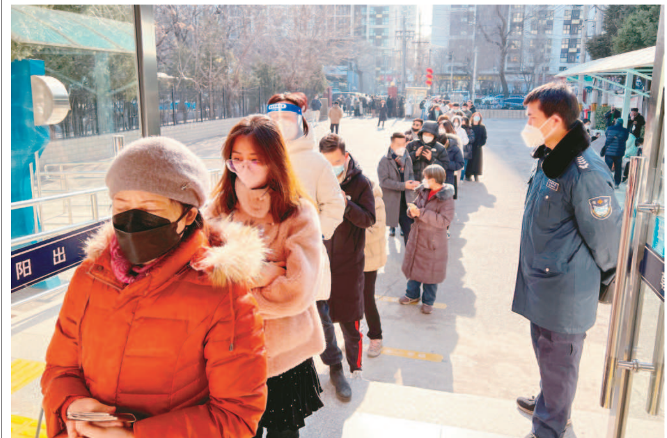
大陸重開國門 民眾趕著出國 ↑中國大陸八日重開國門，取消實施近三年的入境隔離管制，大陸和香港首階段通關也同步啟動。大陸重開國境後，境內各地湧現趕著出國的民眾。圖為九日北京民眾在政府辦公室排隊辦理出境事務，該辦公室提供包括製作或更新護照及前往香港、澳門和台灣的許可證。

←國民黨團九日提出稅收超徵全民共享發放現金特別條例，呼籲春節前發放。