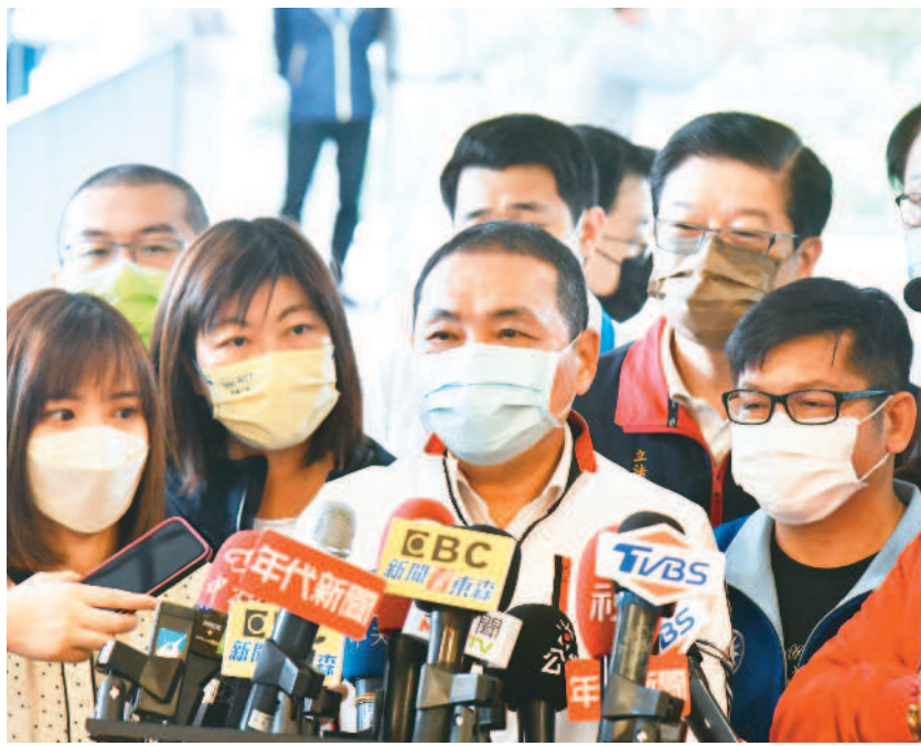
↑新北市長侯友宜強調，為國家人民好好做事最重要，讓台灣這塊土地的人民過得更好。