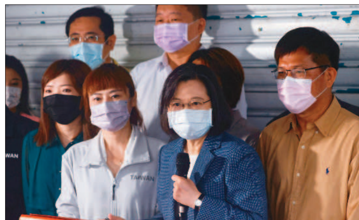
↑九合一選舉民進黨挫敗，總統蔡英文26日晚間宣布辭去民進黨黨主席。

此外，新竹市由民眾黨的高虹安當選市長，苗栗縣、金門縣分別由無黨籍的鍾東錦、陳福海當選縣長。四年前的九合一選舉全國二十二縣市中，國民黨取得十五席縣市首長，民進黨六席，無黨籍一席。六都之中，國民黨由侯友宜、盧秀燕、韓國瑜贏得新北市、台中市、高雄市，台北市則由無黨籍的柯文哲連任，民進黨鄭文燦、黃偉哲保住桃園市、台南市兩都。不過，高雄市長補選後來由民進黨陳其邁當選。