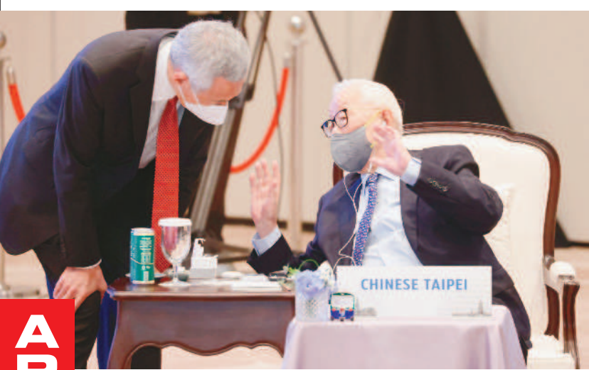
↑台灣APEC領袖代表、台積電創辦人張忠謀17日晚間出席APEC經濟領袖歡迎晚宴，張忠謀和美國國務卿布林肯比鄰而坐，兩人密切交談。