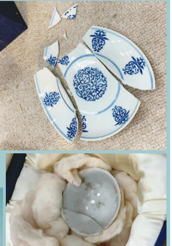
→「清乾隆青花花卉盤」破損情形。(上圖為原件檔案照) (故宮提供) ←「明弘治款嬌黃綠彩雙龍小碗」破損情形。(左下兩圖為原件檔案照) (故宮提供) →「清康熙款暗龍白裏小黃瓷碗」破損情形。(下圖為原件檔案照) (故宮提供)