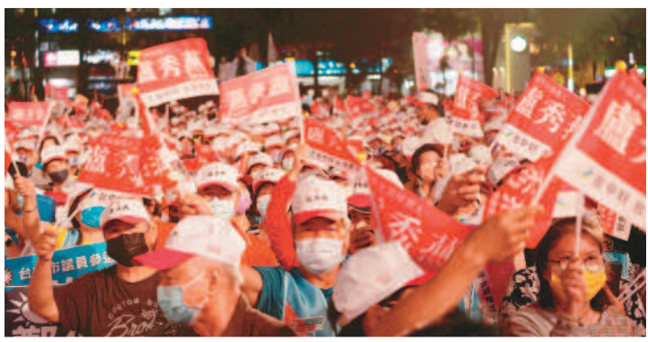
↑「十全十美、女力挺台灣」造勢晚會，現場湧入逾兩萬熱情的支持者。