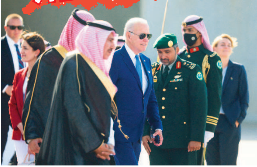
↑美國總統拜登稱世界處於「末日決戰」風險。白宮強調，美國未見俄羅斯近期準備動用核子武器的跡象。圖為拜登結束沙國行程後，步行登上飛機。

本報綜合外電報導 美國總統拜登稱世界處於「末日決戰」風險。白宮昨天表示，拜登的警告不是根據最新情報研判，而是嚴肅看待俄國總統普亭言行的；美國未見俄羅斯近期準備動用核子武器的跡象。 拜登日前表示，自一九六二年古巴飛彈危機以來，世界就沒再面臨發生核戰末日的可能性；但當前烏克蘭反政持續告捷，普亭以核武威脅「不是在開玩笑」。 拜登說：「我想弄清楚，普亭有什麼下台階？他如何才能既不丟面子，又保住俄羅斯內部大權？」 白宮新聞秘書尚皮耶昨天表示，拜登的警告並非出於任何最新情報評估，美國並未發現任何普亭決定將核武投入