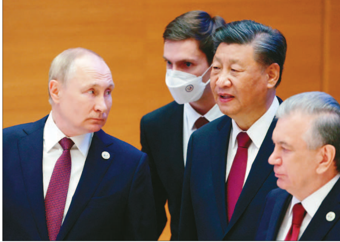
↑俄羅斯總統普亭(左一)十六日在烏茲別克舉行的上合峰會(SCO)中，與中國大陸國家主席習近平(右二)一同呼籲區域國家應重塑國際秩序，被外界視為係欲與西方強權一爭世界影響力的表態。

本報記者綜合外電報導 上海合作組織峰會(簡稱上合會，SCO)十六日在烏茲別克撒馬爾罕召開，中國大陸國家主席習近平在會中呼籲，區域國家應重塑國際秩序，「重要的是防止外部勢力在上合組織成員國製造『顏色革命』」。俄羅斯總統普亭則對「新權力中心」影響力日增表示歡迎。 法新社報導，在烏茲別克舉行的上海合作組織高峰會被宣傳成對西方全球影響力的挑戰，這場會議有中國、大陸、俄羅斯、伊朗及中亞國家領袖出席。 習近平與會時指出，領袖們應「共同努力，推動國際秩序朝著更公正合理的方向發展」，堅持多邊主義，上合會成員國應「摒棄零和博弈和集團政治」，並「維護以聯合國為核心的國際體系」，同時要防範外部勢力策動顏色革命，共同反對以何藉口干涉其他國家事務。 習近平說，中國大陸經濟韌性強、潛力足，長期向好的基本面不會變，支持積極穩妥做好上合組織擴員工作，加強共建一帶一路倡議，同各國開展戰略及地區合作。他強調，將會向有需要的發展中國家提供價值十五億元人民幣的糧食等緊急人道援助，又稱願意在未來五年為上合組織成員國培訓兩千名執法人員。 普亭則在與會時指稱，現在上合組織是世界上最大的區域性組織，在解決國際和地區問題上發揮著越來越大的作用，「新權力中心彼此合作，作用越來越大：作用日益清晰。」 至於印度總理莫迪則呼籲成員國發展供應鏈。他說，新冠疫情大流行和烏克蘭危機導致全球供應鏈中斷，全世界都面臨前所未有的能源和糧食危機，上海合作組織應努力發展可靠和多種多樣的供應鏈，而為此需要改善各國之間的關係。