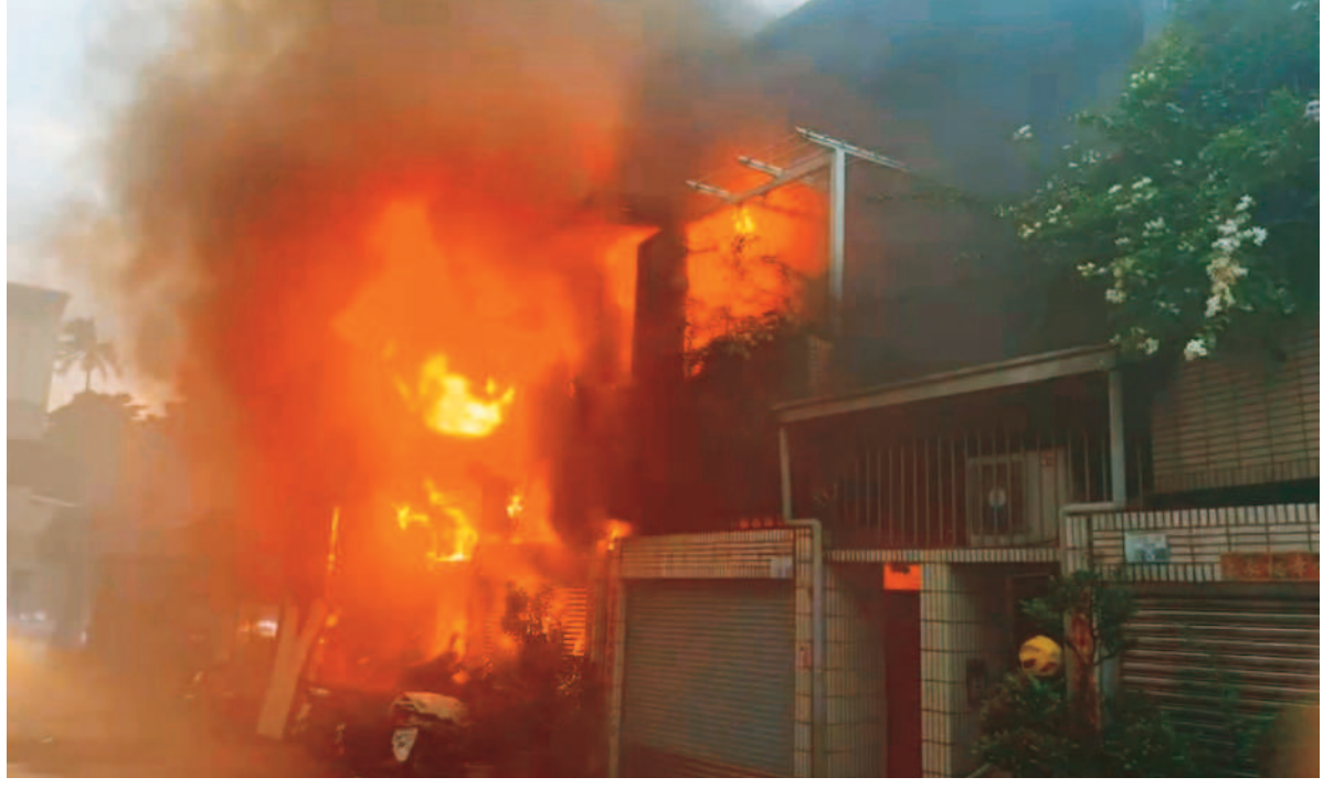
永康復國一路民宅疑似烤肉引發火警，現場烈焰冲天（上圖）。消防人員在二樓臥房找到三具焦屍（左圖）。