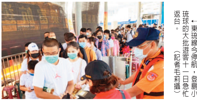
東琉線今停航，登島小琉球的大批遊客十一日急忙返台。