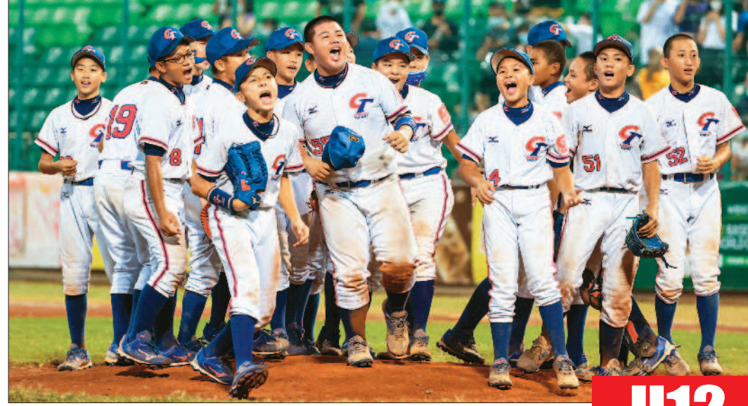
↑中華隊挺進季軍戰，小將賽後在場上開心吶喊。

至於海運部分，交通部指出，主要受影響者為基隆港、台北港及高雄港，進出港的船舶另訂航行計畫，避免進入臨時危險區。根據航港局統計，五日全日國內七處國際商港進港船舶計一百四十一艘次，出港船舶計一百三十七艘次，相較四日進出港船舶無明顯受影響情形。交通部並指出，為確保船舶航行安全，航港局除已發布船舶航行安全，週知台灣周邊海域船舶避開相關區域外，海軍中心也全天候監控周邊海域船舶航行動態，以維航安。