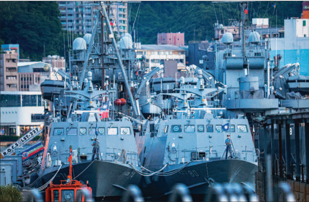
↑國防部表示，截至六日下午五時，二十架次共機、十四艘次共艦在台北海峽中線北端，國軍透過空中兵力、艦艇及岸置飛彈應處。圖為基隆港威海營區內停泊的光華六號飛彈快艇。

記者王誌成／台北報導 國防部六日表示，上午偵獲多批中共戰機、船艦於台北海峽中線，研判是模擬演練對台本島實施武力、海軍運用空中偵巡兵力、海軍艦艇，以及岸置飛彈適切應處。英國軍事專家分析，中國大陸未來若發動武力犯台，可能會以海上封鎖令台灣斷糧，或是發動史上最暴力血腥的兩棲突擊，迫使台灣屈服。