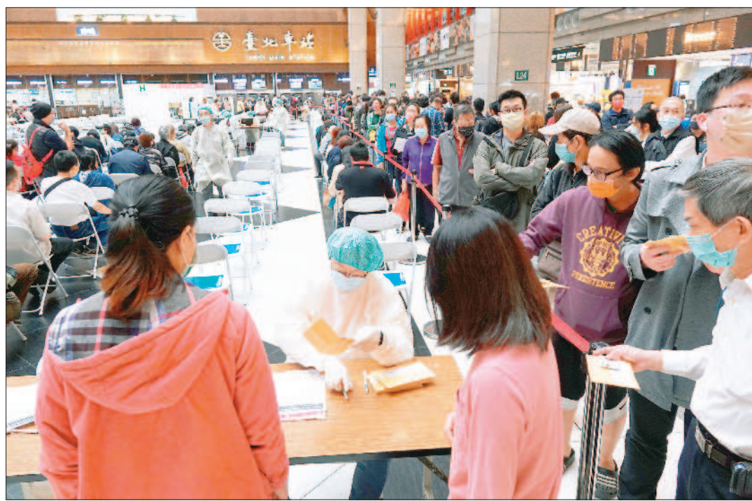
→本土疫情持續升溫，七日新增三百八十二例，再創今年單日新高。設於台北車站的疫苗接種站下午提供三百劑疫苗現場掛號，民眾大排長龍。(中央社)

記者陳柏翰/台北報導 台灣疫情持續升溫，本土病例七日新增三百八十二例再創新高。中央流行疫情指揮中心指揮官陳時中表示，根據國外經驗都是一至二個月間到達高峰，台灣有可能一天新增超過一千五百例，未來一、兩個月對抗疫情要特別小心。他也示警，娛樂場所群聚傳播速度非常快，很多傳播鏈正在進行中，需要特別注意。 陳時中表示，昨天新增三百八十二例本土個案遍及十七縣市，以新北市一百一十一例居冠，台北市八十七例次之，第三則是高雄市的五十九例，其餘為基隆市四十一例、桃園市二十八例、花蓮縣十六例、嘉義縣八例、新竹縣七例、台南市與屏東縣各五例、台中市四例、新竹市三例、金門縣、宜蘭縣與雲林縣各兩例、苗栗縣與彰化縣各一例。 陳時中指出，目前有幾波疫情，從基隆小吃店案到高雄雅閣、金芭黎及帝堡群聚，都有娛樂場域內相關傳播，這類群聚傳播速度非常快，需要特別注意。以現階段疫情發展分析，國內仍有很多傳播鏈正在進行中，個案數恐將會持續上升。 他也提到，根據國際Omicron變異株疫情流行趨勢分析，約一至二個月間就會達到疫情流行高點，有些規模較大、有些較小，要估計精確很難，但可作參考，屆時台灣有可能一天新增超過一千五百例。因此未來一至二個月要特別小心疫情，「沒辦法期待疫情完全不起來」，但期待疫情緩慢流行，才可避免醫療量能超載。 指揮官昨日公布新增五百三十一例確定病例，分別為三百八十二例本土個案與一百四十九例境外移入；無新增死亡病例。(相關新聞刊A2)