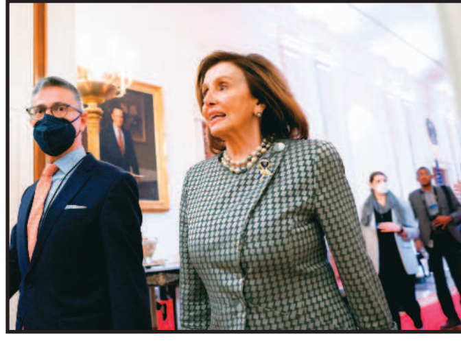
↑美國眾議院議長裴洛西將訪問台灣。圖為裴洛西日前出席白宮活動。

記者王超群/台北報導 外媒報導，美國眾議院議長裴洛西將在十日訪問日本後，調整行程訪問台灣。外交部七日表示，洽邀美國各層級官員和政要訪台是外交部對美工作重要的一環，相關人士的邀請若有具體進展，將適時對外說明。立法院長游錫堃則表示，雖然他知道一點點，但不方便講；裴洛西若訪台，具有非常重大意義，非常歡迎。日本富士新聞獨家報導，裴洛西將在十日訪問日本與首相岸田文雄會晤後，調整行程訪問台灣。對此，歐江安表示，洽邀美國各層級的官員與政要訪台，一向是外交部對美工作重要的一環，外交部與駐美各館處也都持續推動洽邀美官員政要訪台。對於相關人士的邀請，如有具體進展，會在適當的時候對外說明。 另外，美國聯邦參議院外交委員會主席梅南德茲將於十五日訪台，與總統蔡英文、眾議院外交委員會主席米克斯斯近期內訪台等相關事宜，歐江安表示，政府一向歡迎美國國會議員訪問台灣，這也是外交部重要的工作項目。 游錫堃昨接受廣播專訪指出，裴洛西行程須尊重美國發布的消息，「所以我現在不方便講什麼，雖然有知道一點點，但是不方便講」。對於裴洛西訪台一事，中國大陸外交部發言人趙立堅說，美國國會應嚴格遵守美國奉行的「一個中國」政策，陸方已向美方提出嚴正交涉。國台辦發言人馬曉光也說，美國政府與國會一些人不斷挑釁，打「台灣牌」搞「以台制華」，大陸方面將「堅決回擊」。 裴洛西若訪台，將是一九九七年後近二十五年來另一位訪台的美眾院議長。