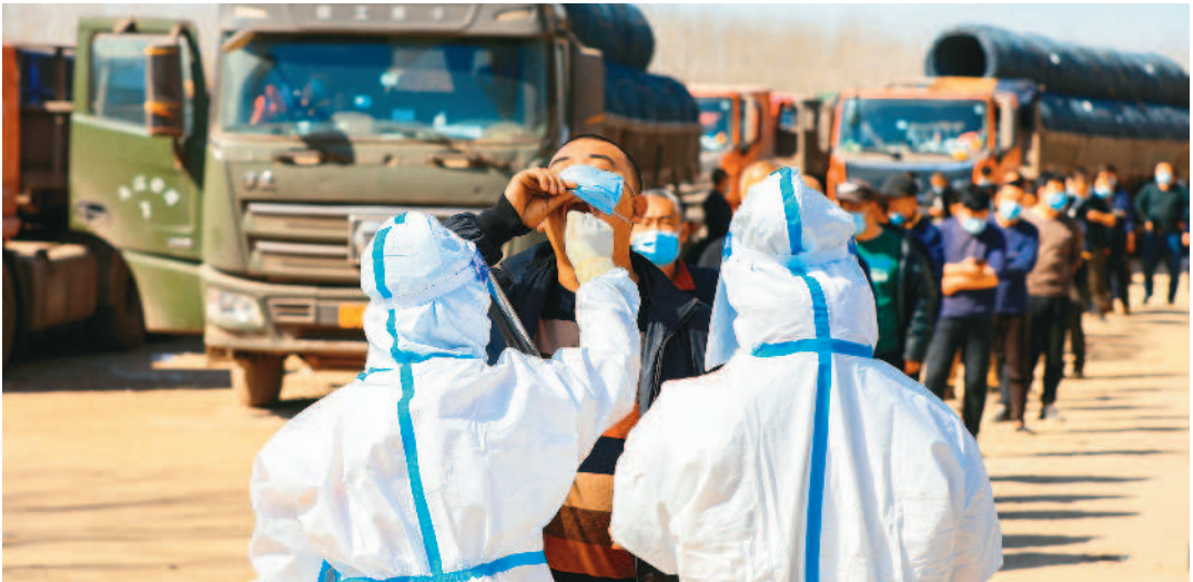
←上海二十七日新增三千五百例確診，疫情防務小組決定在全市開展新一輪「切塊式、網格化」核酸篩查。

本報記者綜合報導 中國大陸二十七日新增六千二百一十五例本土個案，以上海三千五百例最多。上海二十八日起以黃浦江為界，分兩區先後分別封閉管轄。 上海前天新增本土確診病例五十例，無症狀感染者三千四百五十例。上海疫情防務工作領導小組決定，昨天起在全市範圍內開展新一輪「切塊式、網格化」核酸篩查，以黃浦江為界分兩區先後封閉管轄。上海疫情防務工作領導小組決定，昨天起在全市範圍內開展新一輪「切塊式、網格化」核酸篩查，以黃浦江為界分兩區先後封閉管轄。企業實施居家上班。 中共上海市委書記、市疫情防務工作領導小組組長李強表示，新一輪核酸篩查是當前疫情防務下上海疫情防務工作的關鍵之舉。專家指出，上海疫情呈現區域聚集和全市散發並存兩個特點，存在向上爆發的潛在風險，須採取更果斷措施。