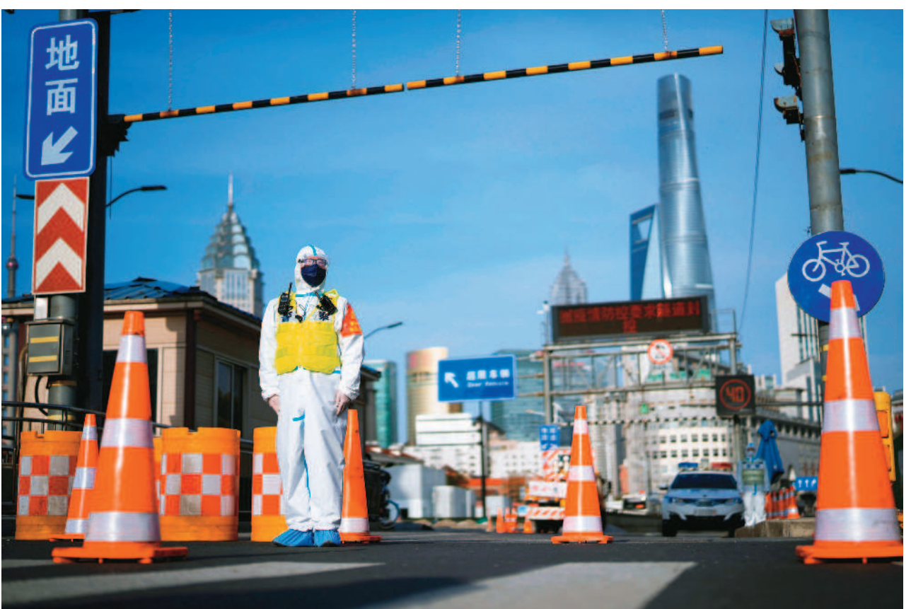
↑上海疫情升溫，二十八日起以黃浦江為界，分兩區先後分別封閉管轄。

上海這波疫情主要流行Omicron亞型變異株B.2.3，至今最少有三百名六歲以下兒童染疫。香港有研究發現，兒童感染B.2.3後的死亡率率是一般流感的七倍，令人關注上海是否像香港出現兒童染疫死亡的情況。Omicron病毒變異株相對容易感染兒童。兒童感染後症狀一般較成年人輕微，重症很少。（相關新聞刊A4）