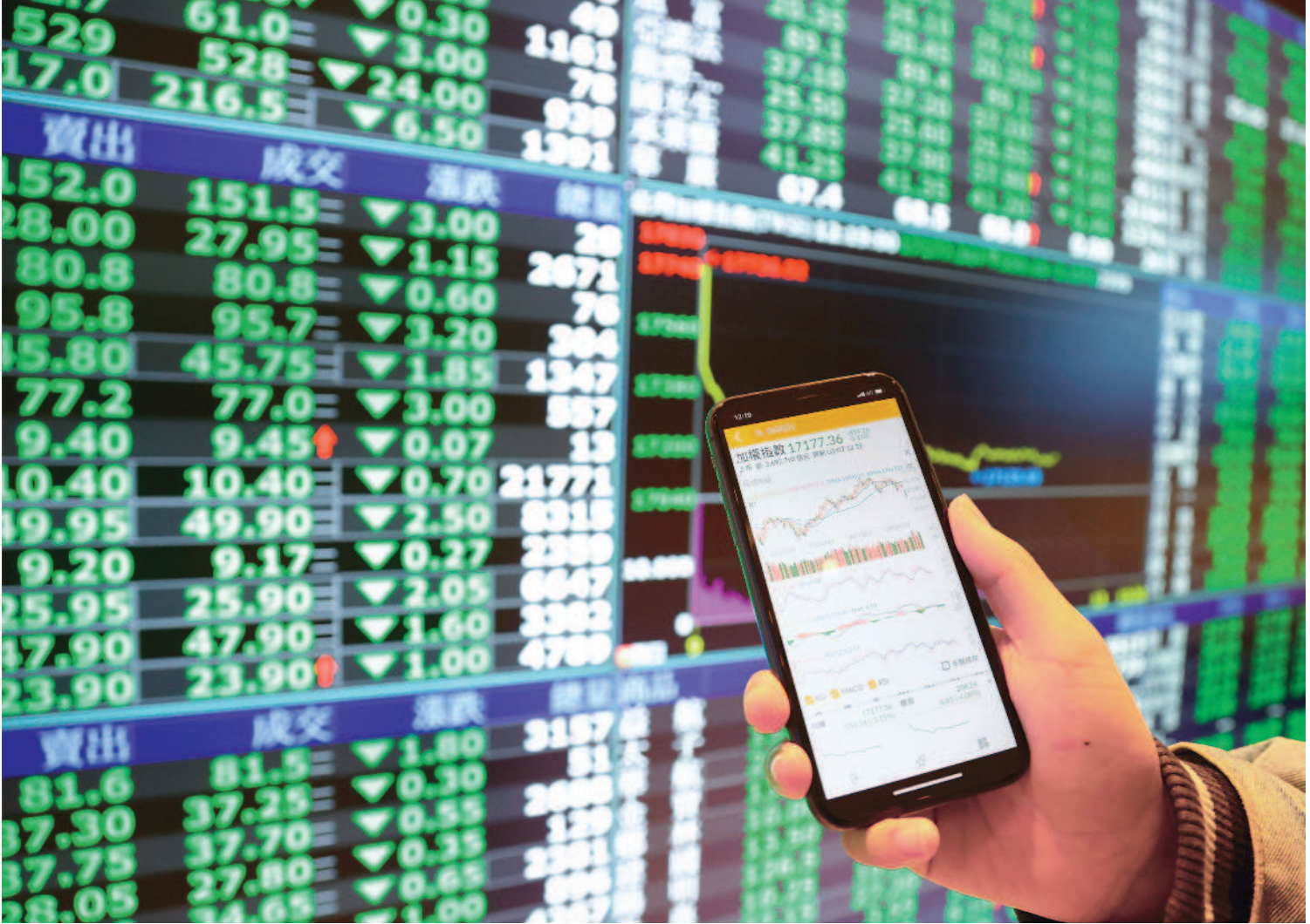
←俄羅斯入侵烏克蘭，台股七日開低走低，終場大跌五百五十七點八三點，失守一萬七千一百點。電子、金融及傳產類股全面下挫。(中央社)

記者陳建興／台北報導 俄羅斯入侵烏克蘭，美國與歐盟計劃禁止進口俄羅斯石油，市場憂心恐衝擊全球經濟，國內股匯雙挫，台股開低走低，終場狂瀉五百五十七點八三點，跌幅達百分之三點一五，以一萬七千一百七十八點六九點作收，失守年線，電子、金融及傳統產業股全面下挫，成交值四千五百六十七點八三億元，為七個多月來的大量。新台幣則重貶一點三五角。 台股權值股與高價股重挫，市值最大的台積電股價收在五十七元六角，大跌十九元，市值縮水四千九百二十六億元，滑降至十四點九三兆元，影響大盤指數約一百五十八點。聯發科股價跌破千元大關，收在九百七十二元，跌出「千金股」行列，台股僅剩「九千金」：鴻海、聯電同步走跌，整體電子類股指數重挫百分之三點四九。 另外，金融類股指數下挫百分之二點七四，傳產股也普遍走跌：僅鋼鐵類股在金屬價格走揚激勵下，指數逆勢上揚逾百分之二，為盤面表現最強勢的族群。 匯市方面，俄烏危機推升通膨疑慮，外資大量匯出，新台幣兌美元收二十八點二五元，貶值一點三五角，創近十個月來最低點。台北外匯經紀公司成交金額二十五點三三億美元，為近十三年的新高；台北與元外匯市場總成交金額則擴大到三十四點八七五億美元。