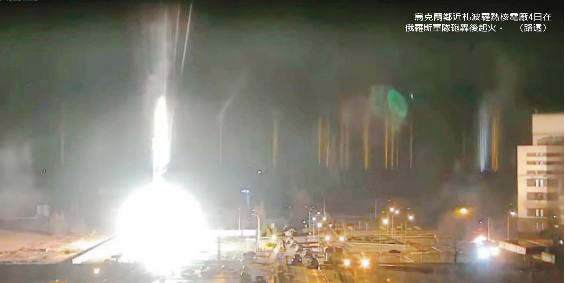
烏克蘭鄰近札波羅熱核電廠4日在俄羅斯軍隊砲轟後起火。