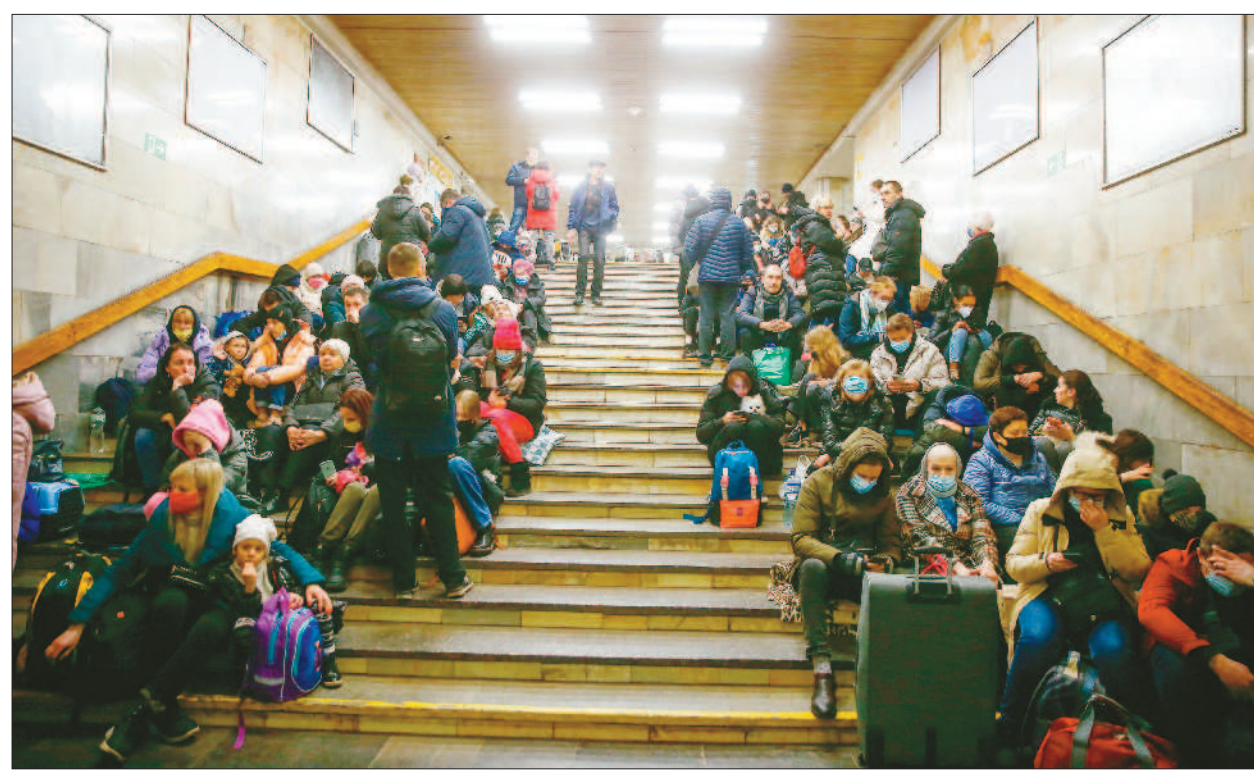
↑俄羅斯入侵烏克蘭，來不及離開的民眾只能躲進地鐵站避難。 ←台北群眾接力抗議俄羅斯入侵烏克蘭，一名外籍女性舉起「台灣與烏克蘭站在一起」標語，另一名女性則將台灣與烏克蘭國旗並列，引人矚目。

府嚴正譴責俄羅斯 台灣參與經濟制裁 記者王超群/台北報導 針對烏克蘭最新情勢，總統府二十五日表示，俄羅斯片面展開軍事行動，政府嚴正譴責俄羅斯對烏克蘭主權的侵害；基於共享民主、人權、法治等普世價值，台灣也將與全球民主夥伴密切合作，參與國際社會對俄羅斯的經濟制裁。 總統府發言人張惇涵表示，關於俄羅斯片面展開軍事行動，我國政府嚴正譴責俄羅斯對烏克蘭主權的侵害，以及對於區域及全球和平穩定的破壞。呼籲各方恢復和平對話，理性解決爭端。而台灣作為國際社會的一員，對於有助於和平解決爭端，都願意參與。台灣也將與全球民主夥伴密切合作，參與國際社會對俄羅斯的經濟制裁。 外交部則發表聲明指出，中華民國政府嚴厲譴責俄羅斯違反聯合國憲章發動戰爭，為敦促俄方停止對烏克蘭的軍事侵略，以及儘速恢復各方的和平對話，中華民國政府宣布將參與國際社會對俄羅斯的經濟制裁。 外交部指出，中華民國台灣政府重申並再度呼籲尊重烏克蘭主權獨立及領土完整，反對以武力或脅迫方式片面改變現狀，支持各方在國際法架構下，透過和平、理性的對話與協商解決歧見。台灣將持續與美國及其他理念相近國家緊密協調，採取適當的因應作為，協助烏克蘭早日遠離戰禍，恢復區域及全球的和平與穩定。