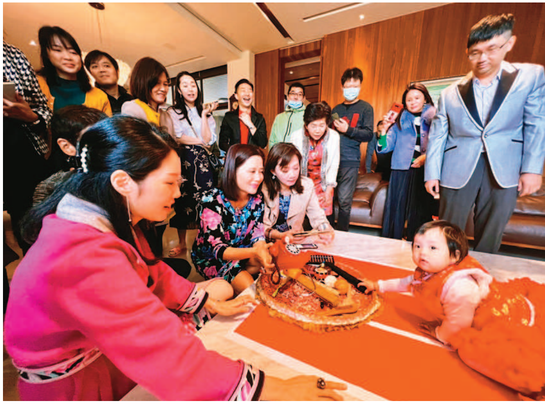
「少子化已成國安問題，根據立法院法制局最新研究報告，建議政府擴大增加育兒相關的所得稅優惠，甚至研議將鼓勵生育相關優惠措施規定入憲。圖為近來已少見的幼兒抓週儀式。」