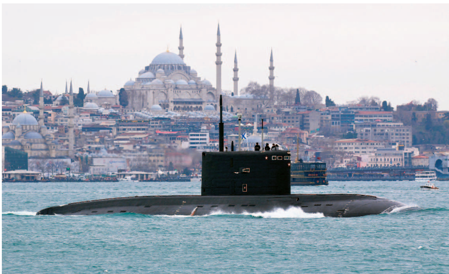
↑俄羅斯、烏克蘭戰爭一觸即發，帶動國際油價上漲。圖為俄羅斯潛艇駛往黑海。(路透)

記者戴淑芳／台北報導 近來共機擾台情況加劇，甚至疑似侵入我東沙島領空，國民黨透過臉書發出聲明表示，對於此種運用武力脅迫方式傷害中華民國主權的舉動，表達強烈譴責，呼籲中國大陸勿再以挑釁作為升高兩岸對立，應積極交流對話，才能化解兩岸分歧，共同維護兩岸及區域和平穩定。 國民黨表示，南海諸島包括東沙島在內屬於中華民國的領土，中華民國對南海諸島及其相關海域享有國際法及海洋法的相關權利，不容有任何質疑。而東沙島距離高雄二百四十四哩，雖然位於我「防空識別區」(ADIZ)之外，但我早已劃設「領海基線」，中共軍機行為嚴重挑戰主權，破壞兩岸關係與台海和平穩定。 國民黨指出，我國派駐東沙島官兵，係屬海巡執法人員，嚴正呼籲中共切勿在東沙島周邊進行軍事行動。對於中共一再運用無人載具、軍機、軍艦等軍武載台侵擾中華民國領土，我方絕對不能接受。相信國軍捍衛國家的決心，也要求政府應對離外島的防務組建及設備進行適切調整。 而有關兩岸政策主張，國民黨強調，國民黨的立場相當明確，「捍衛中華民國」、「堅持民主自由價值」，兩岸和平是全台灣人民衷心的期待，各方可能挑起戰爭的任何舉措與作為，也絕對無法為台灣人民所接受。 媒體報導指稱，共機前天進入我東沙「領空」襲擾，民間並錄下我方戰管驅離共機廣播內容，我方警告共機已進入我「領空」。國防部昨天澄清表示，十二日並無共機進入東沙領空。