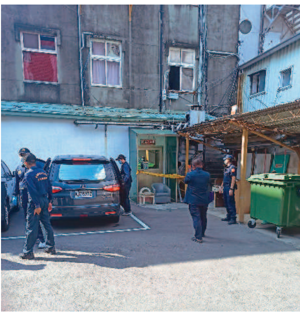
↓高雄一名陳姓通緝犯於日前開槍襲警後，逃至台南市中西區某旅社。 (記者王勗攝)