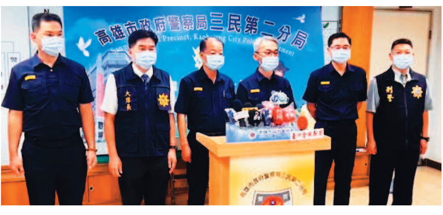
↑高雄警方舉行記者會，說明槍戰經過。

記者蔣謙正、王勗/高雄、台南連線報導 高雄岡山警分局員警十月二十六日查訪一件通緝案，遭陳姓犯嫌持槍射擊，警方三十一日凌晨持拘票至台南市中西區某平價旅館破門攻堅，陳先朝自己頭部開兩槍自戕未果，隨即將槍口指向攻堅警方，當場遭警方射擊十六槍倒地，經送往成大醫院急救宣告不治。檢方相驗發現陳身上有十七個彈孔，詳細死因將待解剖確認。 高雄岡山警分局壽天派出所陳姓、劉姓員警，十月二十六日至三民區昌裕街一棟透天厝追查因殺人未遂案遭通緝的黃姓老翁，同棟透天厝其他分租房內四名毒犯以為行跡敗露，衝出門外駕車逃逸。過程中，四十二歲陳姓男子持槍對警方射擊，造成陳姓員警左小腿遭跳彈擊中擦傷。高雄警警方組成專案小組，先後將李、林、陳三嫌查緝到案，剩開槍射擊員警陳嫌在逃。 高雄警警方昨天舉行記者會，說明槍戰經過。警方日前掌握情資，得知陳嫌逃到台南，並於中西區友愛街某平價旅館下榻，高雄警警方立即通知台南市保安大隊霹靂小組及轄區分局，昨天凌晨零時許持拘票前往該飯店地下室房間查緝。警方喝令破門入內，卻發現陳嫌已經持槍以待。 警方調查，本案由刑事局偵八大隊偵三隊、刑警大隊、岡山分局、三民二分局、台南市警二分局、三分局、永康分局及保安警察大隊共組專案小組，報請高雄地檢指揮偵辦，昨天凌晨零時四十分許持拘票在台南市中西區友愛街某平價旅館地下一樓出租套房，執行拘捕陳嫌(四十二歲)，現場由台南市保安大隊特務組編組警力攻堅，甫破門時，見陳嫌坐於床上持槍對自己頭部射擊兩次未果(二顆退彈有擊發痕)，續拉滑套上膛槍口指向攻堅員警，警方依法使用警械射擊十六槍，以制止陳嫌繼續開槍射擊。 陳嫌中槍倒地後失去呼吸心跳，警方立即通報救護人員到場實施急救，送成大醫院急救後，宣告不治。案發現場由轄區台南市警局派員進行封鎖、實施鑑識及後續相驗作為；並於現場查扣改造手槍一枝、子彈十四顆、毒品安非他命四包(計四十四點六公克)、吸食器三組、現金六萬二千零一十五元等證物。 台南市保大隊長劉全福表示，開槍的三名警員從警未滿十年，三人均未曾在查緝現場開過槍，本次查緝遇到試圖開槍攻擊警方的陳嫌，三人冷靜射擊制伏歹徒，符合警械使用條例用槍規定，後續保大也將配合檢方進行相關調查。 警方表示，涉案犯嫌已全數到案，依法移請高雄地檢偵辦，案內共計查扣改造手槍一枝、子彈三十顆、毒品海洛因二十四點五公克、安非他命一千零四十九點零七公克、現金八萬餘元、毒品分裝器具一批等證物。 檢方昨天上午至成大醫院相驗陳男遺體，初步發現陳身上有十七處彈孔，分布在頭部、雙手、左腳、前胸，確切死因及子彈貫入與貫出口仍待解剖確認釐清。(珍惜生命，請撥一九九五)