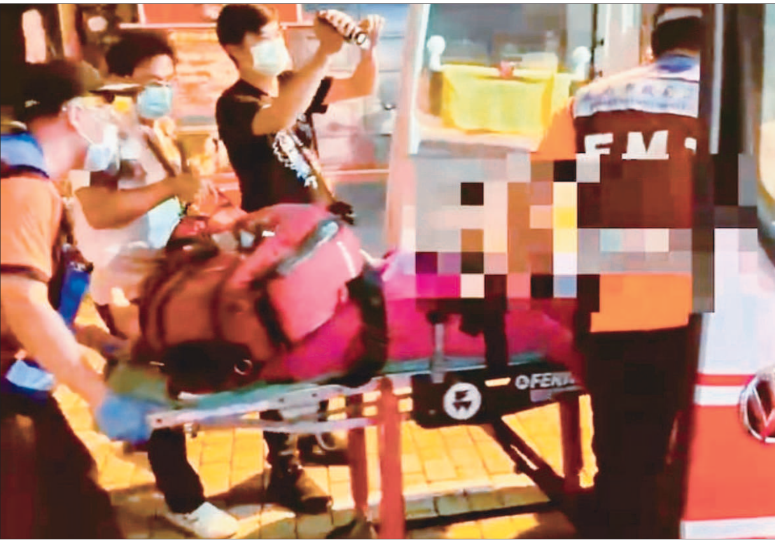
←台南警匪槍戰，陳姓嫌犯持槍拒捕遭警還擊，送醫不治。 ↓高雄與台南警方共組專案小組，31日凌晨在台南拘捕嫌犯時，嫌犯開槍拒捕，雙方發生槍戰。