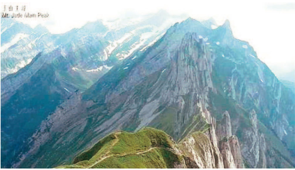
↑外交部國慶影片將玉山誤植為瑞士阿爾卑斯山畫面。 ←左圖為更正後的玉山主峰畫面。