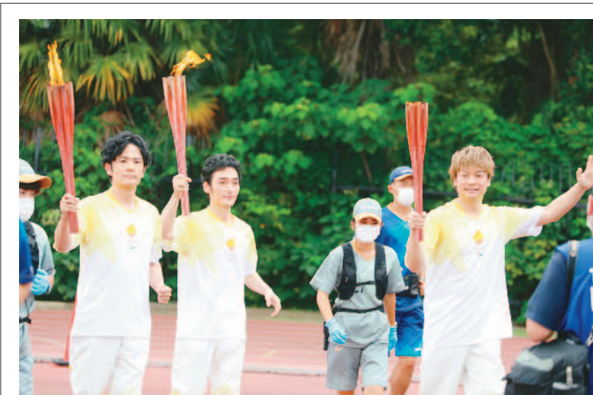
↑儘管日本東京COVID-19疫情嚴峻，東京帕運仍如期於24日晚間舉行開幕式，中午聖火傳遞抵終點東京，前偶像團體SMAP成員稻垣吾郎、草彥剛與香取慎吾擔任最後一棒跑者。(中央社)

於此不幸事件，高端深表關切，並將關注本案後續的原因判定與事實釐清，並持續以最嚴格品質管制製造疫苗以協助國內外防疫需求。