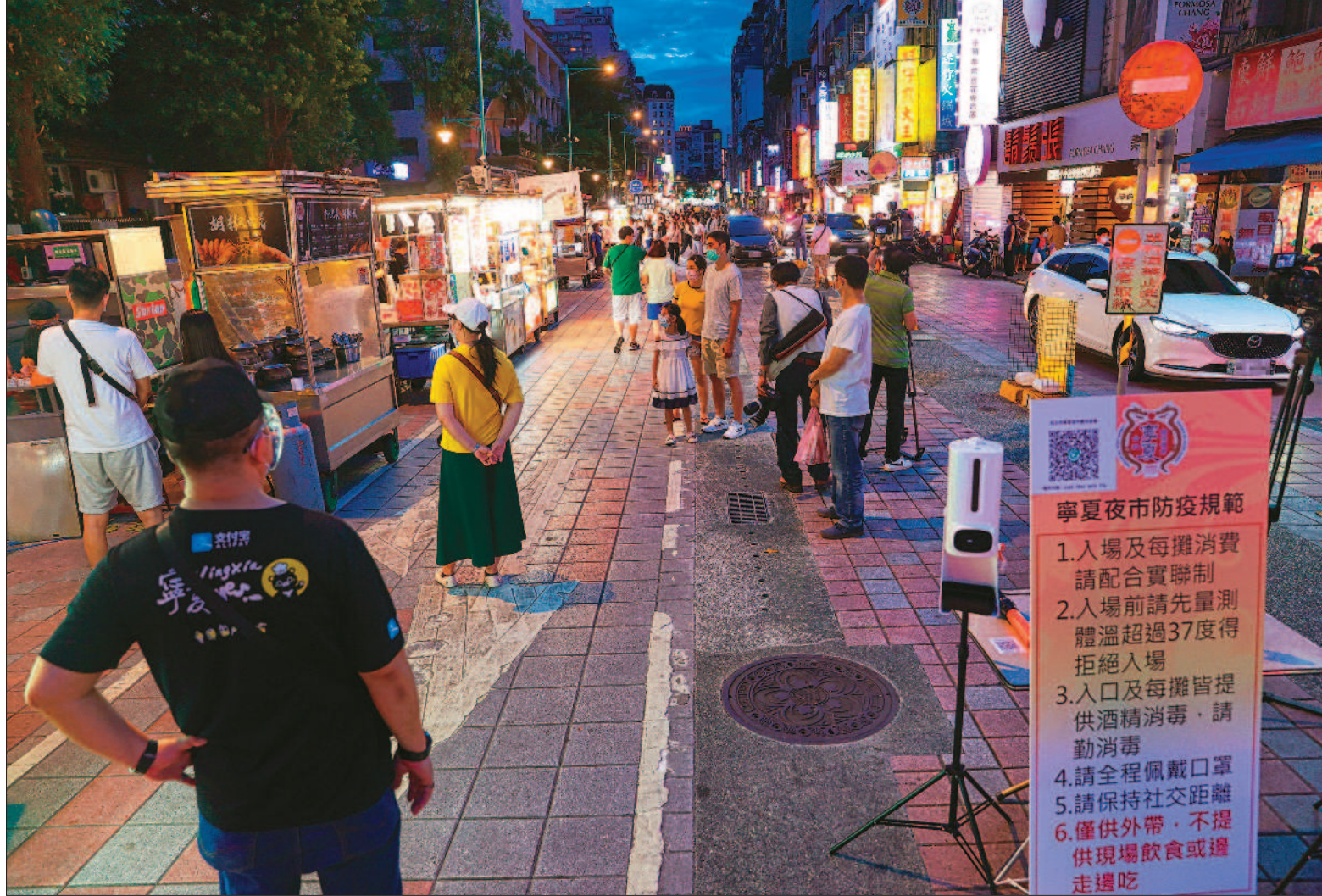
↑北市寧夏夜市微解封，中央流行疫情指揮中心指揮官陳時中三十日鬆口表示，若疫情持續下，開放餐廳或夜市內用，「不是完全不可能」。(中央社)