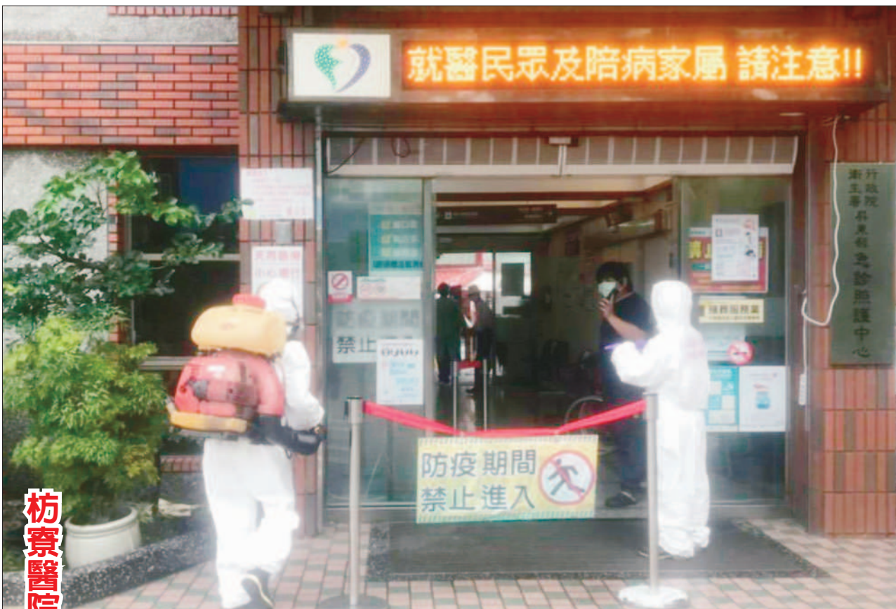
枋寮醫院有可能是枋山鄉Delta群聚染疫者及枋寮確診果農夫妻的感染平台，屏東縣政府全力大清消毒防堵病毒鏈。(記者毛莉攝)

本報記者綜合報導 屏東、台南群聚基因定序二十九日出爐，分別為印度Delta與英國Gamma變異株，確定互無關聯。中央流行疫情指揮中心表示，除秘魯祖孫及指標個案白牌車司機親友外，枋寮七旬果農老翁的病毒基因定序也檢出Delta，老翁妻子也在今日確診，不排除同遭Delta變種病毒株感染。 目前屏東群聚增為十四人，其中有十人檢出是感染Delta變異株。枋寮果農夫妻與秘魯媳曾在六月中於枋寮醫院足跡重疊，正積極疫調中。 枋寮醫院足跡與秘魯媳重疊 指揮中心昨公布，屏東再添一例本土確診個案，為枋寮果農的妻子，經過疫調比對發現，果農夫妻有和秘魯返台媳曾在六月中於枋寮醫院有足跡重疊的部分。 屏東縣政府指出，枋寮果農夫婦近期多次共同騎乘機車至枋寮醫院看診，衛生局已針對兩人擴大匡列採檢對象，除枋寮醫院全院工作人員三百三十二人、全部PCR採檢外；有重疊足跡的民眾、醫護人員等高風險接觸者三百九十九人，全部安排在集中檢疫所採檢並隔離。 衛生局擴大疫調發現，十至十六日間，枋山多名確診者與秘魯媳曾先後到過枋寮醫院急診；住在秘魯媳隔壁的確診者與枋寮果農夫妻，也曾同一天到枋寮醫院急診及門診。 另外，秘魯媳孫十四日送枋寮醫院急診，因為等待採檢結果及打點滴，曾在急診室待了十小時，同一天枋寮果農夫妻也到枋寮醫院門診，其間關聯性還要釐清，不排除可能有接觸的可能。 此外，有關台南市安南區家庭群聚感染確定是Gamma變異株，非Delta病毒。針對此起家庭群聚感染案部分，市長黃偉哲表示，經調查該案家屬有一人呈現抗體陽性、PCR陰性反應，表示曾染疫但已過了發病急性期，相關接觸者中有一名會南北往返的司機，目前也在篩檢中。 市府一連三天在安南果菜市場、安西自辦重劃區免費公有停車場設立篩檢站，全面採用PCR篩檢，第一天共計服務一千三百三十二人，七百七十六人陰性，其餘報告陸續出爐中。