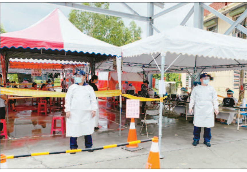
↑屏東縣府請國軍化學兵協助枋山全鄉環境大消毒。(記者毛莉攝) ←枋山鄉設篩檢站。(記者毛莉攝) ↓屏東縣社會處到家戶發送防疫民安物資,請村民安心在家做好防疫。(記者毛莉攝)