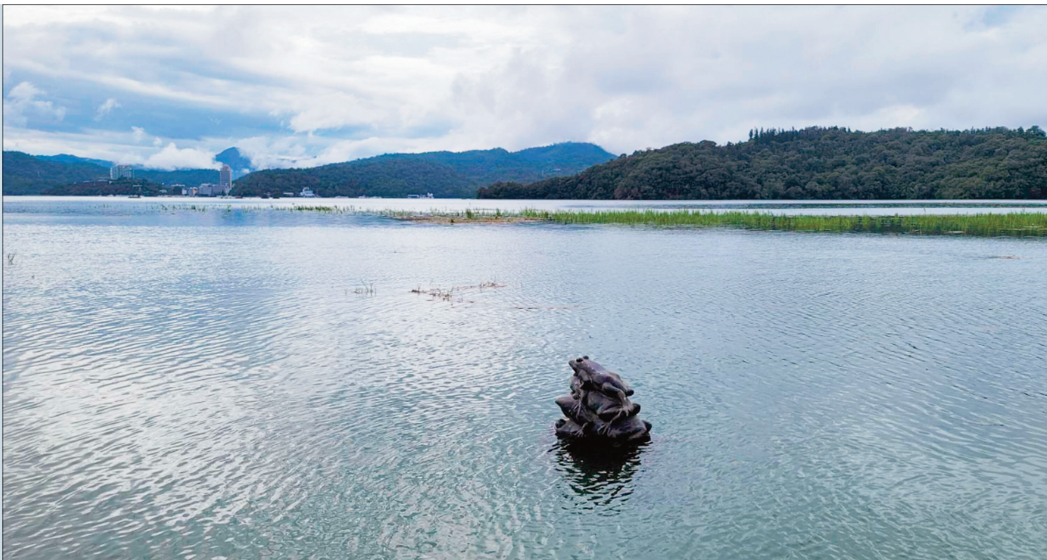
雨落日月潭 第4蛙入水

→日月潭幾乎達滿水位狀態，知名景點「九蛙疊像」由上往下數的第四蛙浸入水中。 (新聞刊A4)