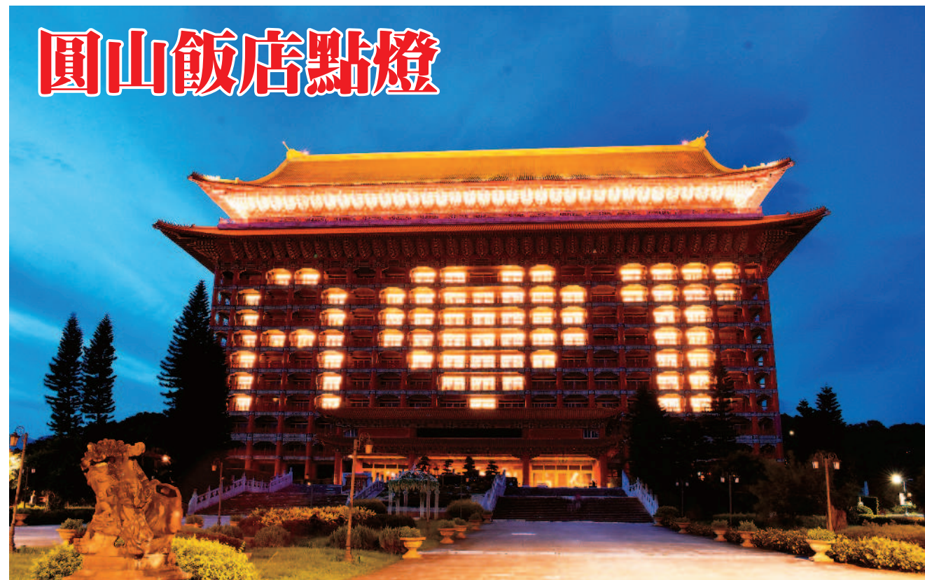
↑美國捐贈的二百五十萬劑莫德納疫苗二十日抵台，圓山飯店點燈「A♥T」，代表「America Love Taiwan」，表達台灣對美方的謝意。