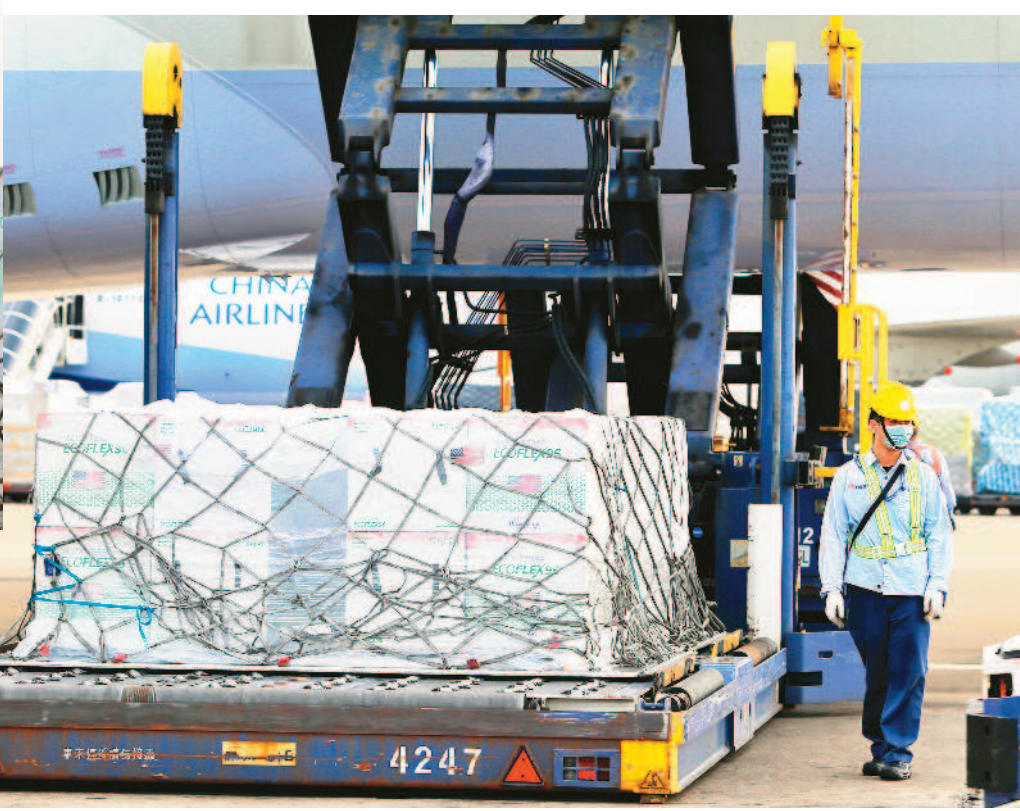
→美國捐贈二百五十萬劑莫德納疫苗二十日下午抵台，華航貨機降落滑行道到華儲前方機坪停放，由地勤人員協助將疫苗溫控貨櫃卸下。 ↑中央流行疫情指揮中心指揮官陳時中（右）與A I T處長酈英傑（左）接機，兩人站在貨箱前拿著感謝標語牌合影。（中央社）