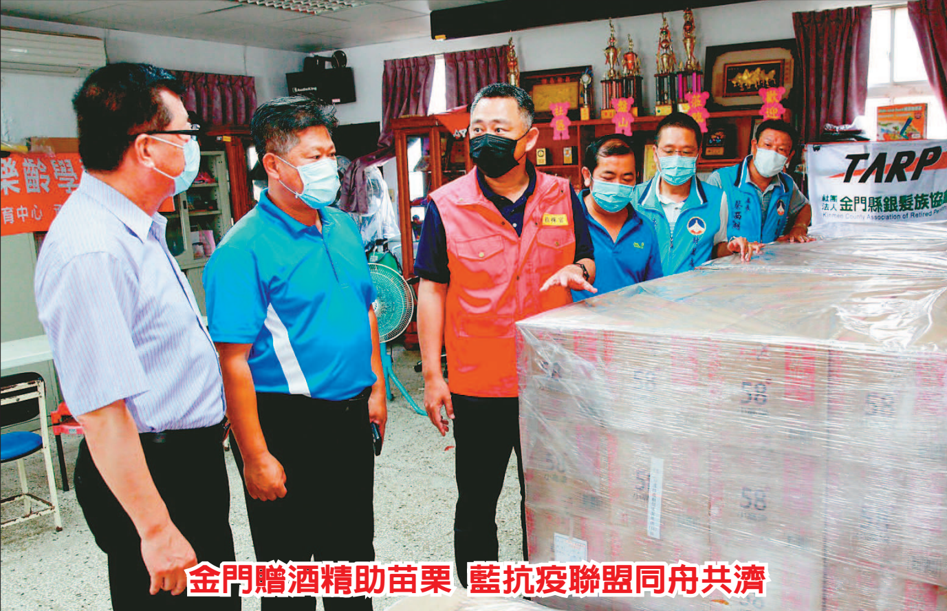
金門贈酒精助苗栗 藍抗疫聯盟同舟共濟 中央政府防疫不力，國民黨結合十四個執政縣市首長組成「抗疫聯盟」。鑑於苗栗縣急缺酒精等防疫物資，黨主席江啓臣八日致電金門縣長楊鎮浚，金門將提供一百四十四箱、共三千四百多瓶酒精，讓苗栗用於清消防疫。(文／記者王超群)