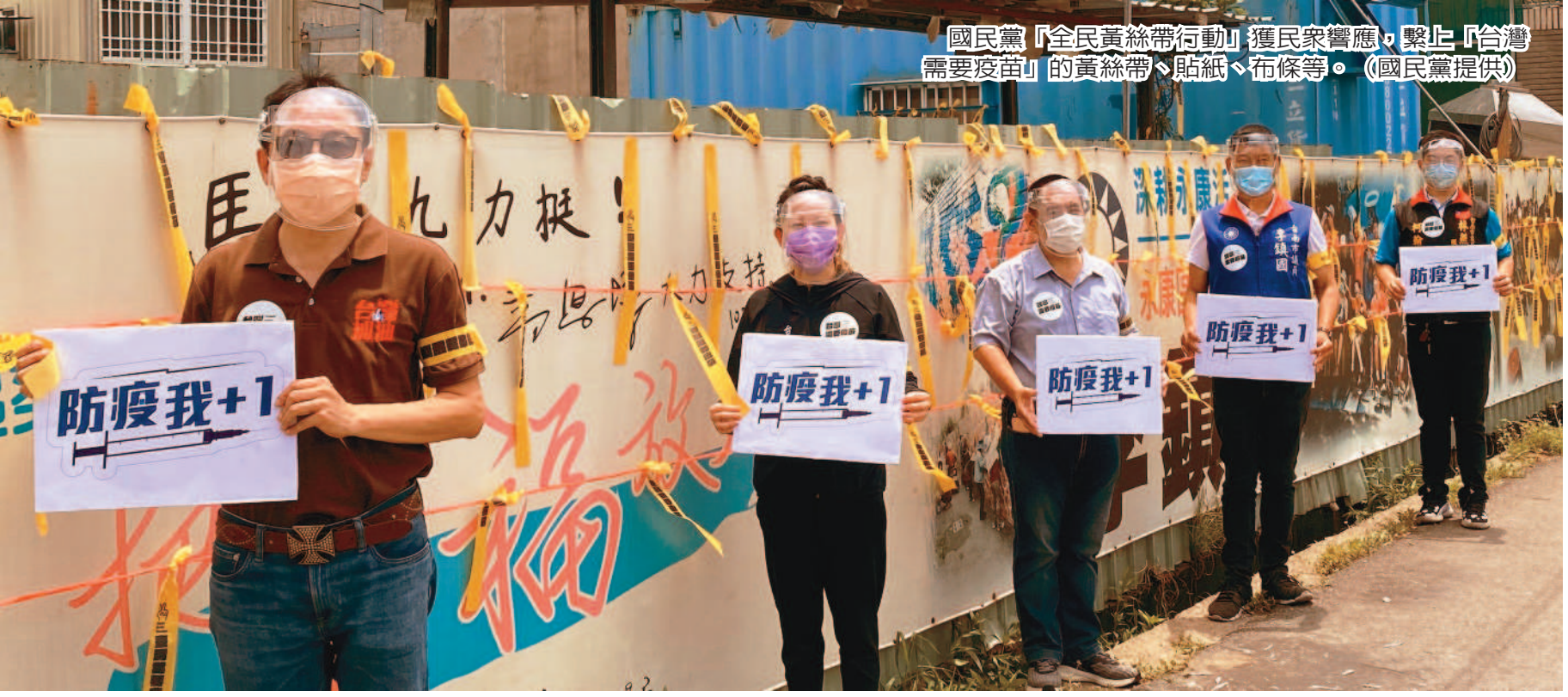
國民黨「全民黃絲帶行動」獲民衆響應，繫上「台灣需要疫苗」的黃絲帶、貼紙、布條等。