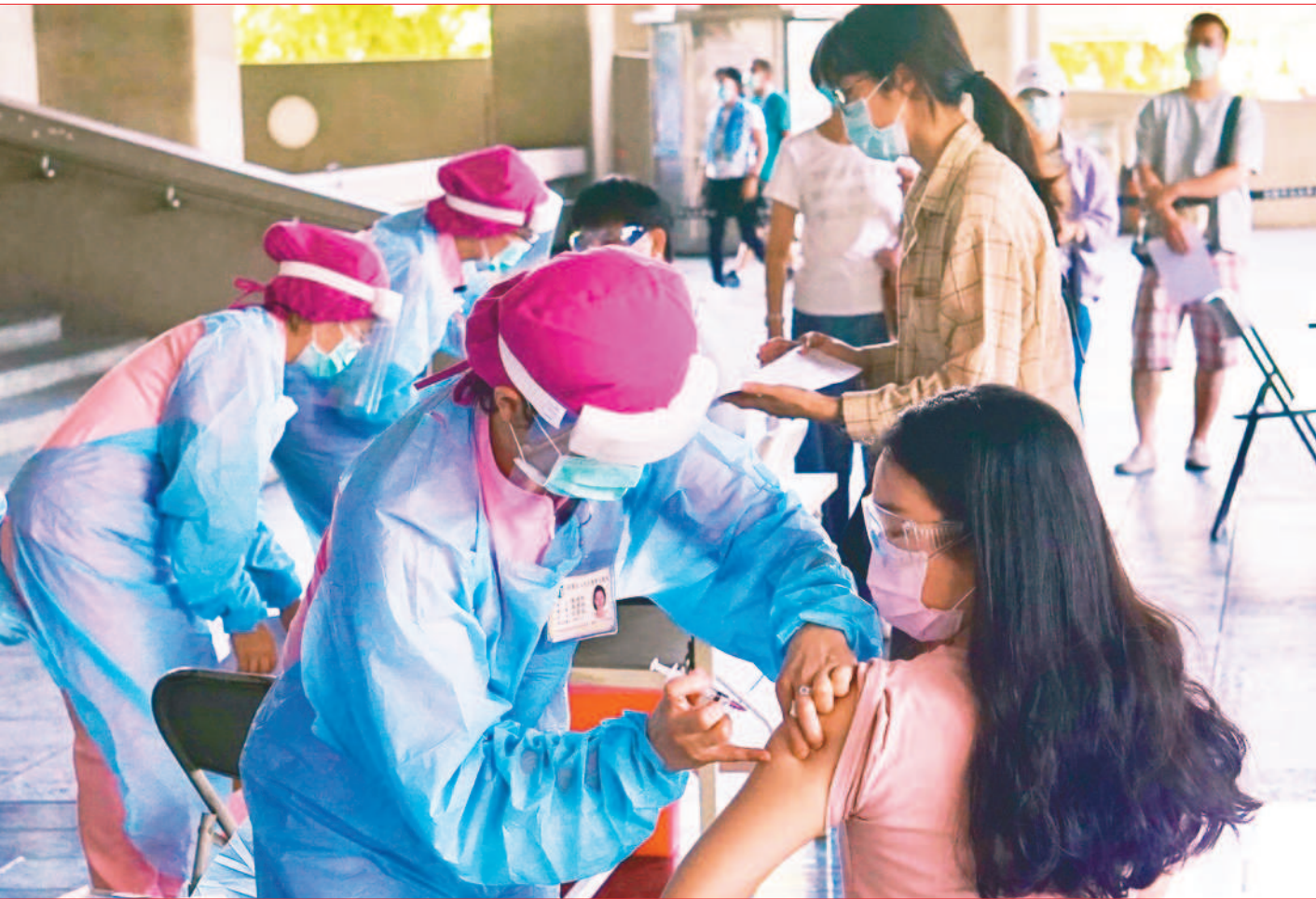
↑中央流行疫情指揮中心二日宣布，規劃疫苗大規模接種計畫，並陸續辦理整備作業，力拚十月完成六成國人可打完第一劑疫苗。