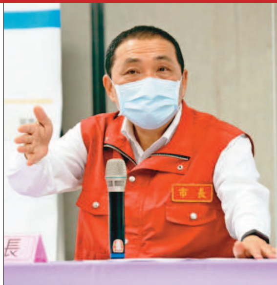
←台北市長柯文哲（中）、新北市長侯友宜（右）與台中市長盧秀燕三十一日為疫苗問題，不約而同向政府嗆聲。（台北市政府提供/記者吳瀛洲攝/記者徐義雄攝）

柯：到底要保護本島生技業還是國人生命 侯：有沒有刁難 人民感受最清楚 盧：不要再畫大餅