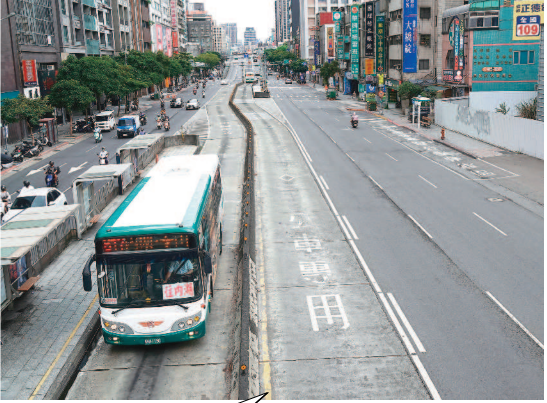
台北市三十日舉行擴大管制兵棋推演，台鐵、高鐵北市境內過站不停，捷運不跨雙北營運、公車僅限北市境內營運，YouBike 停止營運。(中央社)