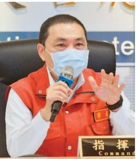
↑ 新北市長侯友宜三十日哽咽表示，現在是和時間搶生命，不是拚醫療量能而已，拜託疫苗快進來，否則醫療量能受不了。