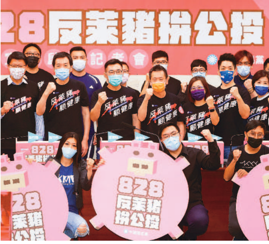
↑國民黨十八日舉行「八二八反萊豬拚公投」全台宣講啓動記者會，眾人高喊口號，希望號召更多民眾響應。