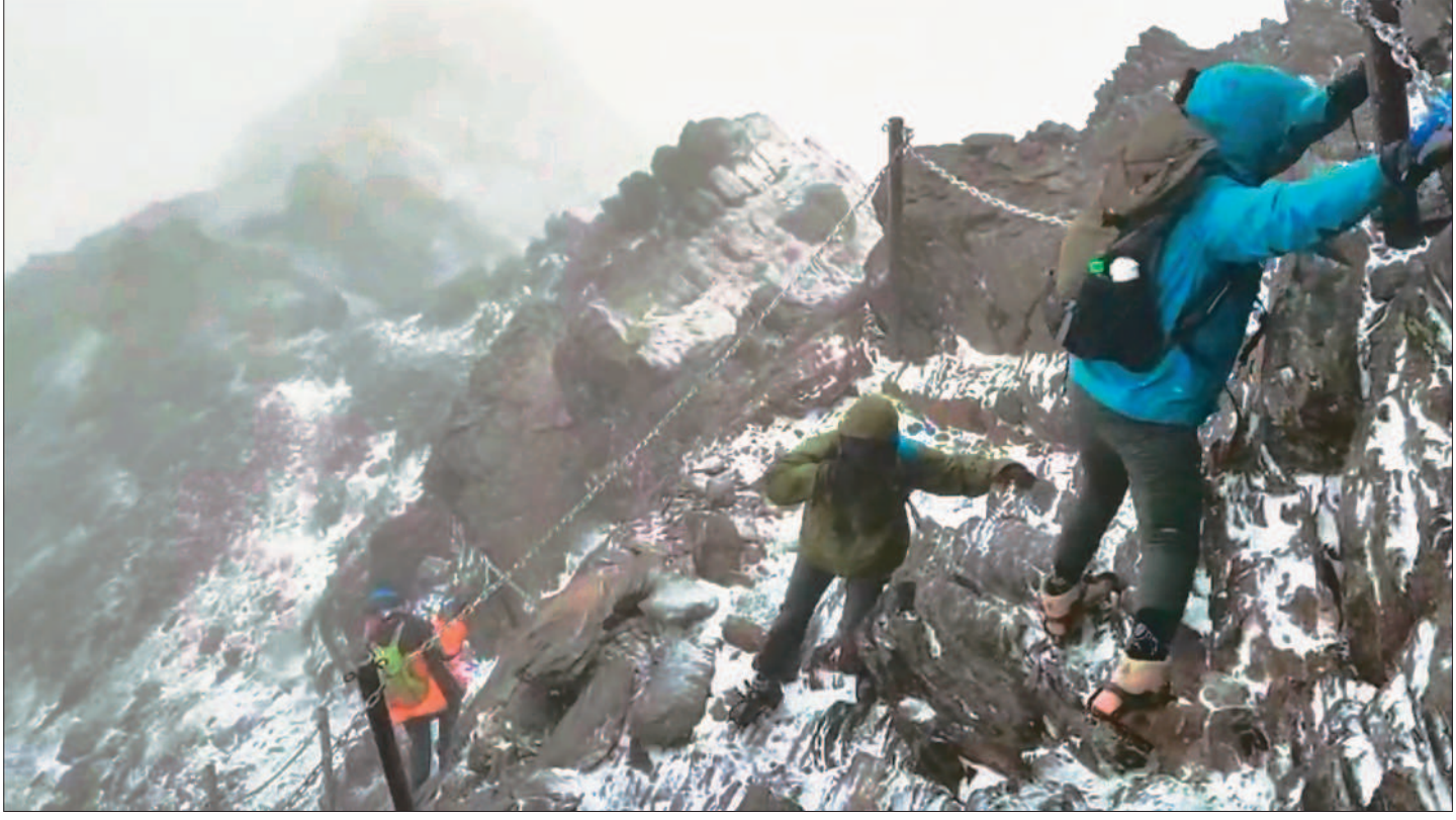
↑玉山二十一日降下入冬初雪，由於步道結冰溼滑，玉山國家公園管理處加強雪地服務措施，並採柔性勸導，維護民眾登山安全。