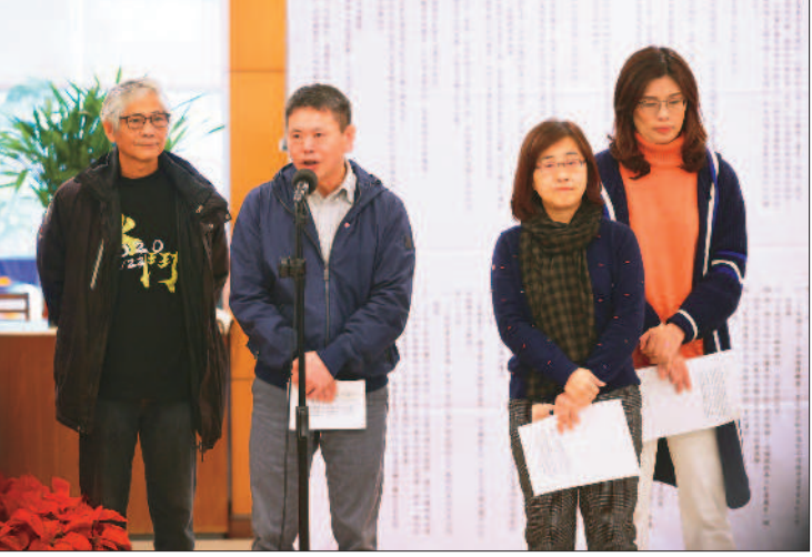
↑國民黨立法院黨團總召林為洲(左二)、書記長林奕華(右二)、首席副書記長鄭麗文(右)等，二十一日上午在立法院舉行記者會。林為洲表示，國民黨團的態度很簡單，就是用盡各種方法，全力阻擋萊豬進口。