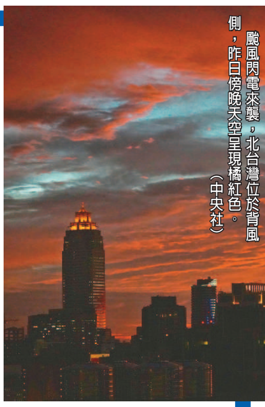
颶風閃電來襲，北台灣位於背風側，昨日傍晚天空呈現橘紅色。

記者陳柏翰／台北報導 中央氣象局六日指出，輕颯閃電逐漸通過台灣南側海面，以目前行進速度，加上地形影響等不確定性因素，預估在七日清晨到白天期間會解除陸上颶風警報。 根據氣象局六日下午五時三十分觀測資料，颶風閃電中心位置在北緯二十一點六度，東經一百二十點七度，即在鵝鑾鼻的南南西方約四十公里處，以每小時十三公里速度，向西北西轉西南西進行。 氣象局指出，閃電颶風之後會通過台灣海峽南部，再往東沙島海面方向移動，因此在東南部沿海還有巴士海峽、台灣海峽海象及東沙島海面，未來都是警戒範圍。 氣象局表示，受到颶風及其外圍環流影響，易有短時強降雨，台東縣、恆春半島、屏東縣山區有局部大雨或豪雨發生的機率；花蓮、屏東地區及綠島、蘭嶼有局部大雨發生的機率，山區慎防坍方、落石及溪水暴漲，低窪地區注意淹水。 氣象局指出，依照目前行進速度，加上地形影響的不確定性，仍然預估在七日清晨到白天期間才會解除陸上颶風警報；颶風中心仍是沿著恆春半島南端海面通過的機率較高，進入台灣海峽後因為海面上的條件加上東北風南下，都會漸漸不利發展，在二十四至三十六小時內會減弱為熱帶性低氣壓。 氣象局預估，七日本天之後，恆春半島、台東的降雨就會逐漸減緩；但當天午後東北風逐漸增強，北台灣的雨量會逐漸增加；七日晚間及八日在基隆北海岸及大台北山區、宜蘭都容易出現大雨。 (相關新聞刊A5)