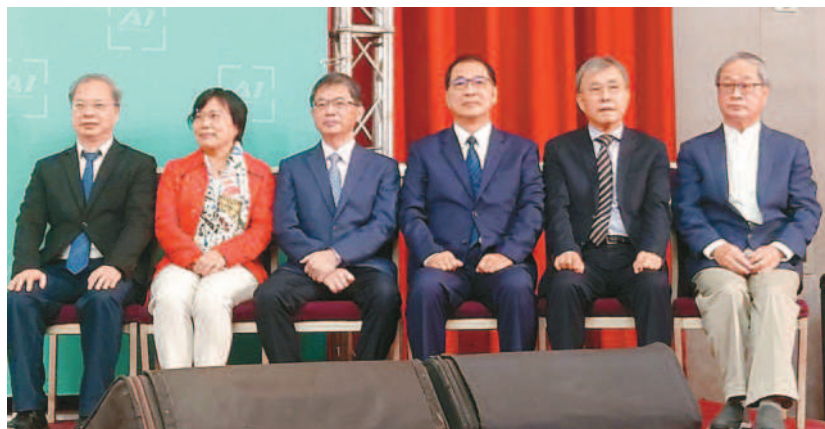
▲準行政院長卓榮泰昨天主持第二波內閣人事記者會，宣布由前立委劉世芳（左二起）接任內政部長、行政院秘書長李孟諺接任交通部長、北檢檢察長鄭銘謙接法務部長、中山大學校長鄭英耀接教育部長、文化部長則由作家李遠（小野）接任。左一為新政府行政院秘書長龔明鑫。

沈育如／臺北報導 準閣揆卓榮泰昨天公布第二波內閣名單，五位新任部長包括內政部長劉世芳、交通部長李孟諺、法務部長鄭銘謙、教育部長鄭英耀、文化部長李遠（小野）擔任。 李遠表示，他在四月初接到徵詢，認為被徵詢的原因是，他在八〇年代將臺灣電影推向國際，曾在電視臺工作、