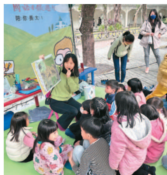
▲《國語日報週刊》編輯向小朋友介紹週刊專題。

沈育如 / 臺北報導 一一二二臺灣閱讀節主場活動「歡樂閱讀嘉年華」，昨天和今天在中正紀念堂園區登場，現場除了延續往年的書香市集、好書推廣、手作體驗、繪本說故事、行動書車等活動，主辦單位國家圖書館也邀請十個駐臺大使館與機構參與，展現該國的圖書出版與文化特色。 教育部次長林明裕在「歡樂故事村」化身說故事大使，與小朋友講述談衰老現象的《健忘的汪達奶奶》、談逆境轉念的《恐龍先生流鼻涕以後》兩本童書。 國家圖書館推廣閱讀的海報，與民眾分享國外圖書館推廣閱讀經驗。 《國語日報週刊》也在「歡樂故事村」設攤位，由專欄作家、說故事姐姐與編輯同仁，帶來著色與尋寶遊戲、說故事與手作、認識動物與黏土創作等六場活動，讓小朋友聽故事、玩游戏，寓教於樂。