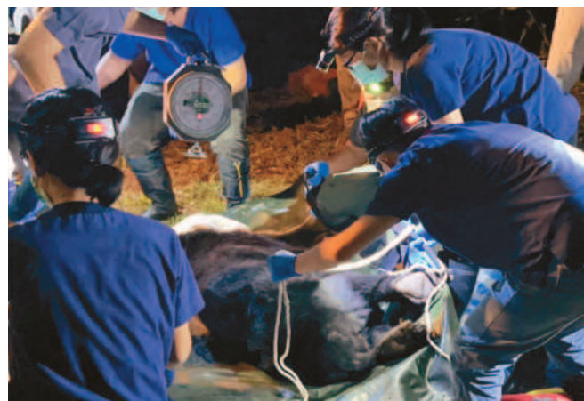
▲臺灣黑熊闖入工寮，被發現時已倒臥屋內、全身抽搐，雖經救援仍死亡。