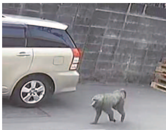
一隻狒狒在桃園市平鎮區逃竄，被民眾拍到牠逛大街的身影。