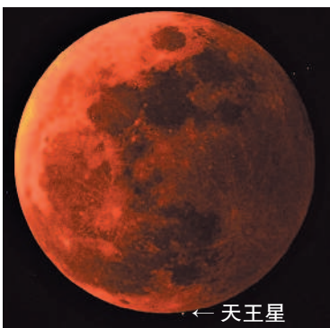
▲月全食掩天王星是罕見的天文奇景。