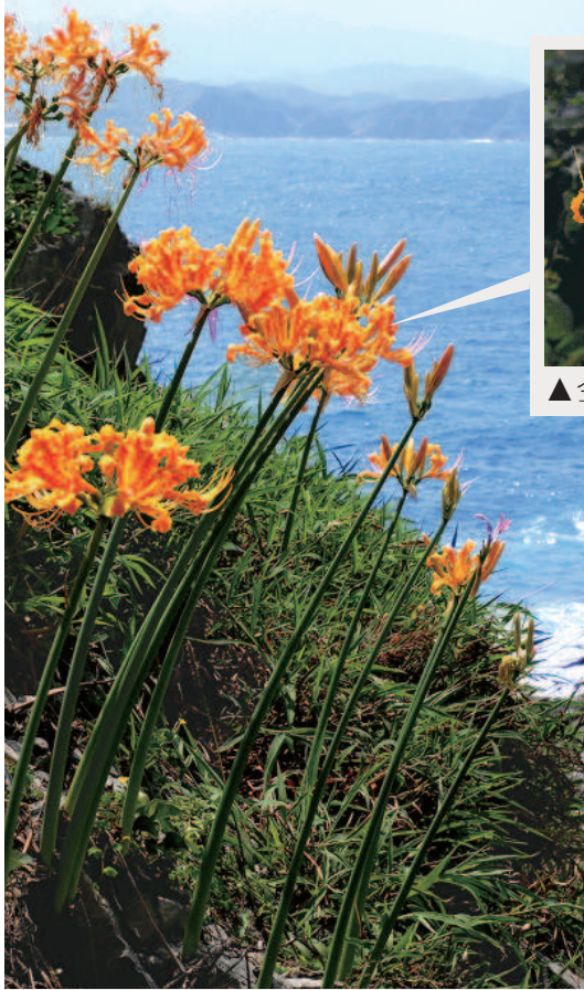
▲金花石蒜主要生長在臺灣東北角海邊；花朵在八月到十月盛開。