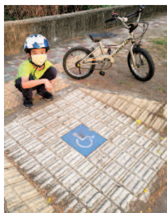
▲家鄉中的無障礙設施。

以「無障礙設施」為例，是指定著於建築物的建築構件，使建築物、空間，能讓行動不便者可獨立到達、進出及使用。例如室外通路、避難層坡道及扶手、避難層出入口、室內出入口、室內通路走廊、樓