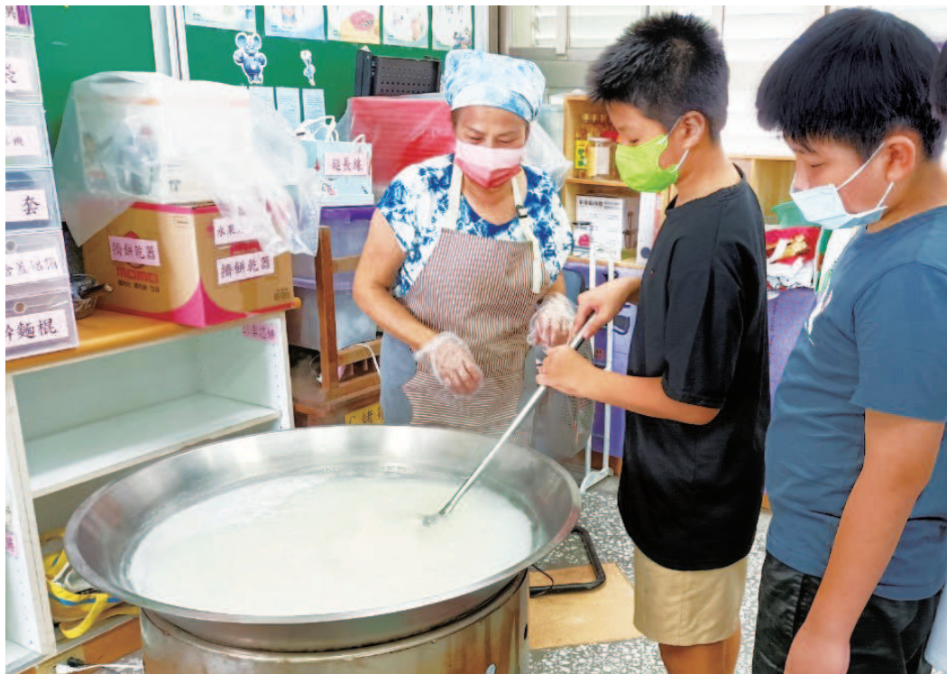
學生輪流拿鍋鏟，攪拌一大鍋白粥。

透過食米教育，宣導在地食材最新鮮的消費觀念，教導孩子健康吃，也把米食文化向下扎根。