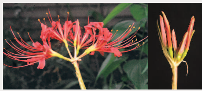
▲石蒜盛開 (左)；石蒜花苞 (右)。