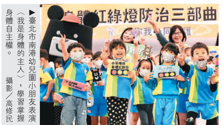
►臺北市南港幼兒園小朋友表演〈我是身體的主人〉，學習掌握身體自主權。

李庭芝／臺北報導 衛福部昨天舉辦「認識身體紅綠燈——學齡前兒童性侵害防治三部曲」發布記者會，以臺灣黑熊為主角推出「小黑啤身體紅綠燈三部曲」，以及〈我 綠燈三部曲〉，以及〈我是身體的主人〉動畫唱跳曲，引導幼童認識身體界限，學習自我保護且尊重他人身體自主權。 據衛福部資料統計，高達百分之六十三的性侵害被害人未滿十八歲，且每一百人中，就有三人是零歲到六歲兒童，雖然這些兒童多數是女生，但男生的比率逐年上升，例如一一〇年就占百分之二十一。點四。學齡前兒童性侵害加害者，超過九成是認識者，其中親屬關係佔最多。