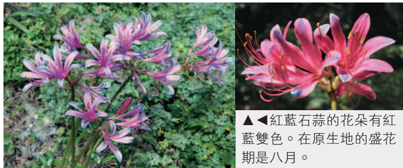
▲▲紅藍石蒜的花朵有紅藍雙色。在原生地的盛花期是八月。

近年，各地花市和花園出現一種葉片寬大的「龍鬚石蒜」(上圖)。花形有點類似紅花石蒜，但雄蕊比花瓣長上許多；它的花和葉會同時並存，花期通常在三月四月，習性和前面介紹的三種石蒜屬植物不同，分類上雖然是石蒜科，卻是另外一個屬，大家要分清楚呵。