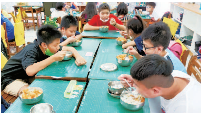
品嘗皮蛋瘦肉粥的滋味。

「食品安全」是重要的生活議題，「支持吃在地」是維護自身飲食權益最直接的方式。透過食米教育，宣導在地食材最新鮮的消費觀念，教導孩子健康吃，也把米食文化向下扎根。