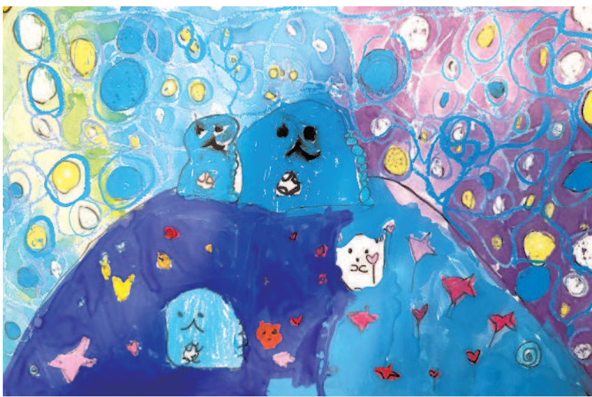
走進生命花園 羅晨勻 · 新竹縣上智小學二年A班