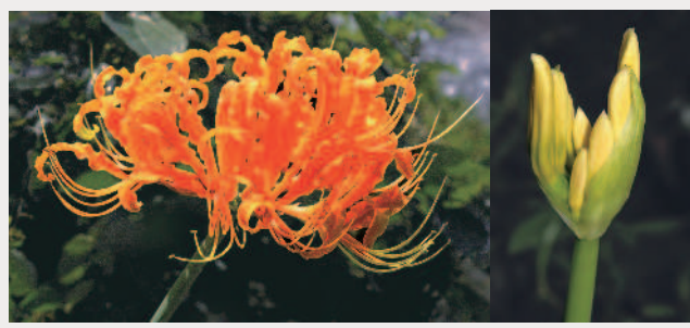
▲金花石蒜盛開 (左)；總苞片露出花苞 (右)。