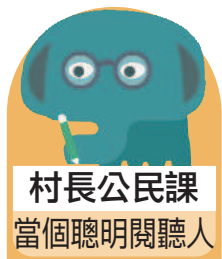
村長公民課 當個聰明閱聽人