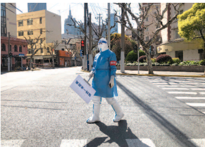
▲中國嚴格控制網路言論，就連疫情期間民眾分享生活點滴也遭審查。圖為四月上海封城。