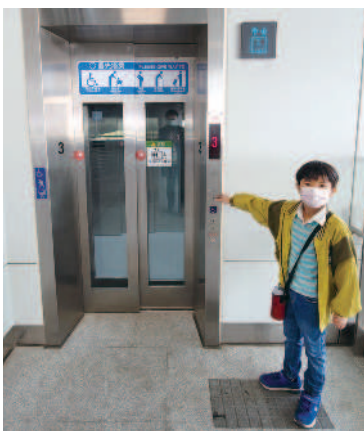
▲捷運站的無障礙電梯。

假如班上有身障同學，可以規畫帶他走訪學區附近的景點，參與班上的戶外教學活動。包括：活動地點、活動時間、參觀重點、為什麼選擇這個地點等，從學校到景點的路途中，對身障同學有哪些便利與不便的設施，你覺得可以增加哪些無障礙設施讓他更方便前往。