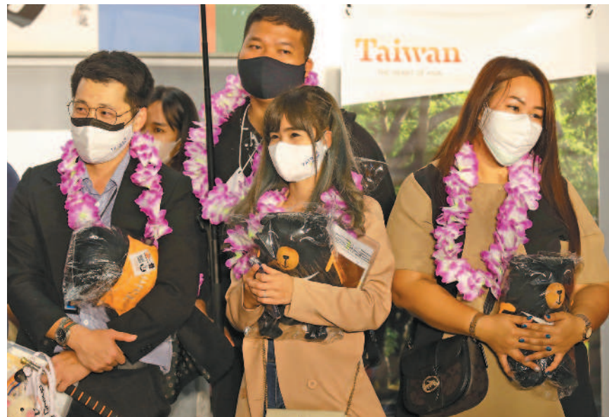
▲臺灣邊境解封首日，首發團是來自泰國的旅客，昨天凌晨抵達桃園國際機場。 文 / 黃瑋靖