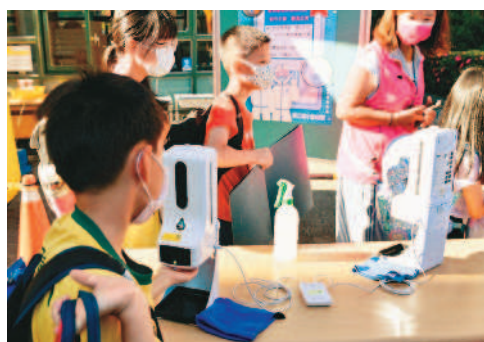
▲各級學校昨天起不再一人確診全班停課，改以篩代隔，若有學生確診，其他師生只要快篩陰性就可上課。圖為各校持續防疫工作，防止病毒進校園。

李庭芝、楊惠芳、陳中興、張彩鳳、陳景清、詹伯望 / 連線報導 全國中小學昨天起實施防疫新制，不再一人確診全班停課，且擴及補習班和安親班，全部以篩代隔，曾與確診者「脫口罩接觸超過十五分鐘」，由學校提供一劑快篩，陰性無症狀者，得照常上課，有症狀者儘速就醫。 疫情新制上路，各縣市教育局處昨天表示，停班大幅減少，學生不再因確診造成班級停課，家長大多認為學習可更穩定；但對