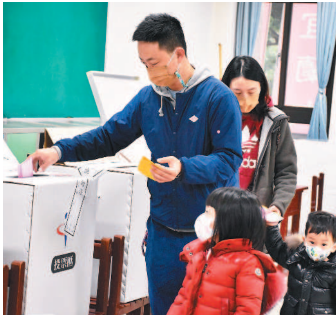
▲四大公投案昨天舉行投票，有些選民帶著六歲以下的孩子進場投下神聖一票，讓孩子認識選舉過程，培養民主觀念。

沈育如、阮筱琪、陳中興 / 連線報導 重啟核四、反萊豬、公投綁大選、三接遷離四大全國性公民投票案昨天舉行投票，結果四案不同意票數都高過同意票，全數遭到否決。中選會主委李進勇表示，中選會委員會將在十二月二十三日審定公告投票結果。根據《公投法》規定，公投案若要通过，有效同意票數必須高於不同意票，且達到投票權人總數的四分之一以上；這次四項公投案通過的門檻是四百九十五萬六千三百六十七張同意票。